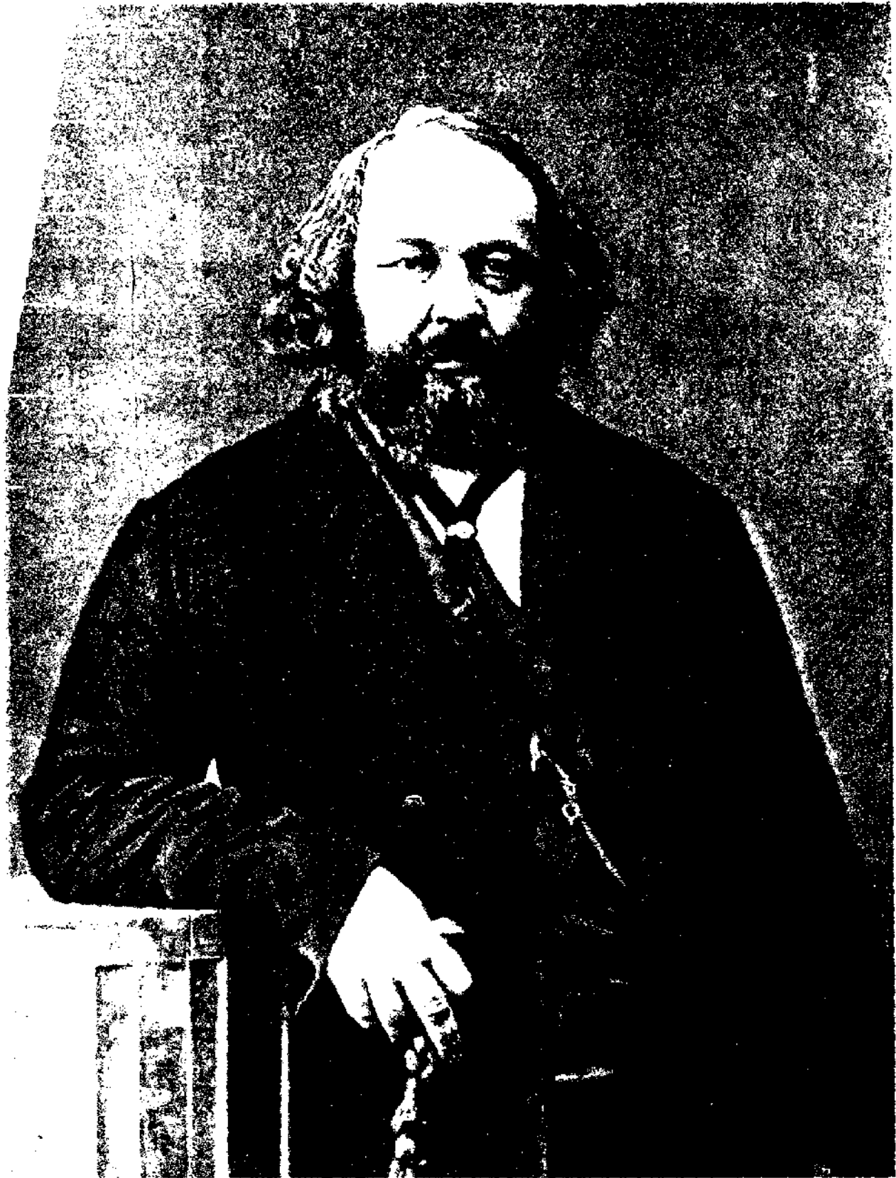
М. А. Бакунин