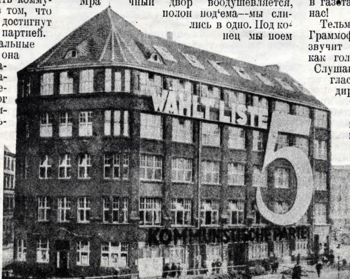
Дом Центрального Комитета германской коммунистической партии в Берлине в дни выборов.

Мрачный двор воодушевляется, полон подъема — мы слились в одно. Под конец мы поем