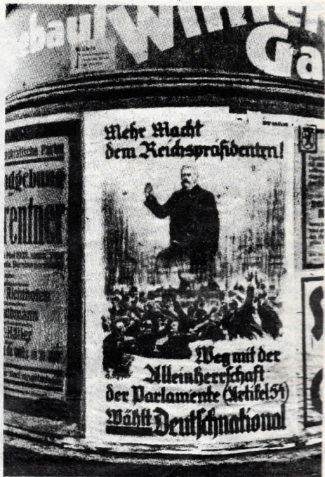
Плакат националистов с портретом Гинденбурга.

Мы снова на улице. Нас догоняет запыхавшийся товарищ. Подмышкой у него маленький граммофонный аппарат. Он взял его у знакомого и купил на свои деньги за три марки пластинку с речью Тельмана. Он изъявляет желание идти вместе с нами и завести свой граммофон.