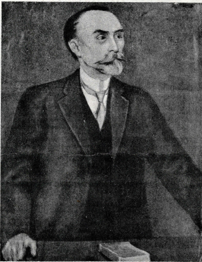
Георгий Валентинович Плеханов.

Капитализм давно уже пробил себе брешь в толще тех укрываний, за которыми целые века укрывался феодальный строй крепостной России. Но со времени так называемых „великих реформ“ в 60-х гг. прошлого столетия он стал себя чувствовать здесь совсем как у себя дома. Восточная Европа покрылась сетью железных дорог. Пышным цветом расцвело грюндерство. Иностранцы капиталы бешено ринулись на российскую целину. Задымили и в больших городах, и в только что обра-