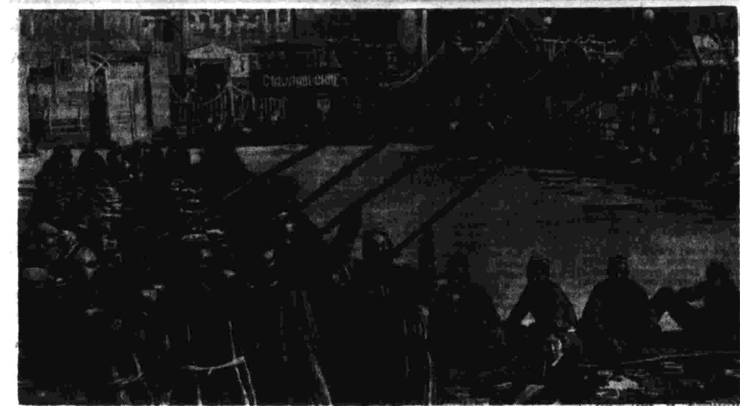
В Ташкенте в честь Съезда Советов и сталинской Конституции состоялся большой народный праздник. На снимке: народный праздник в парке имени Икрамова. Музыканты сымают народ на празднество.