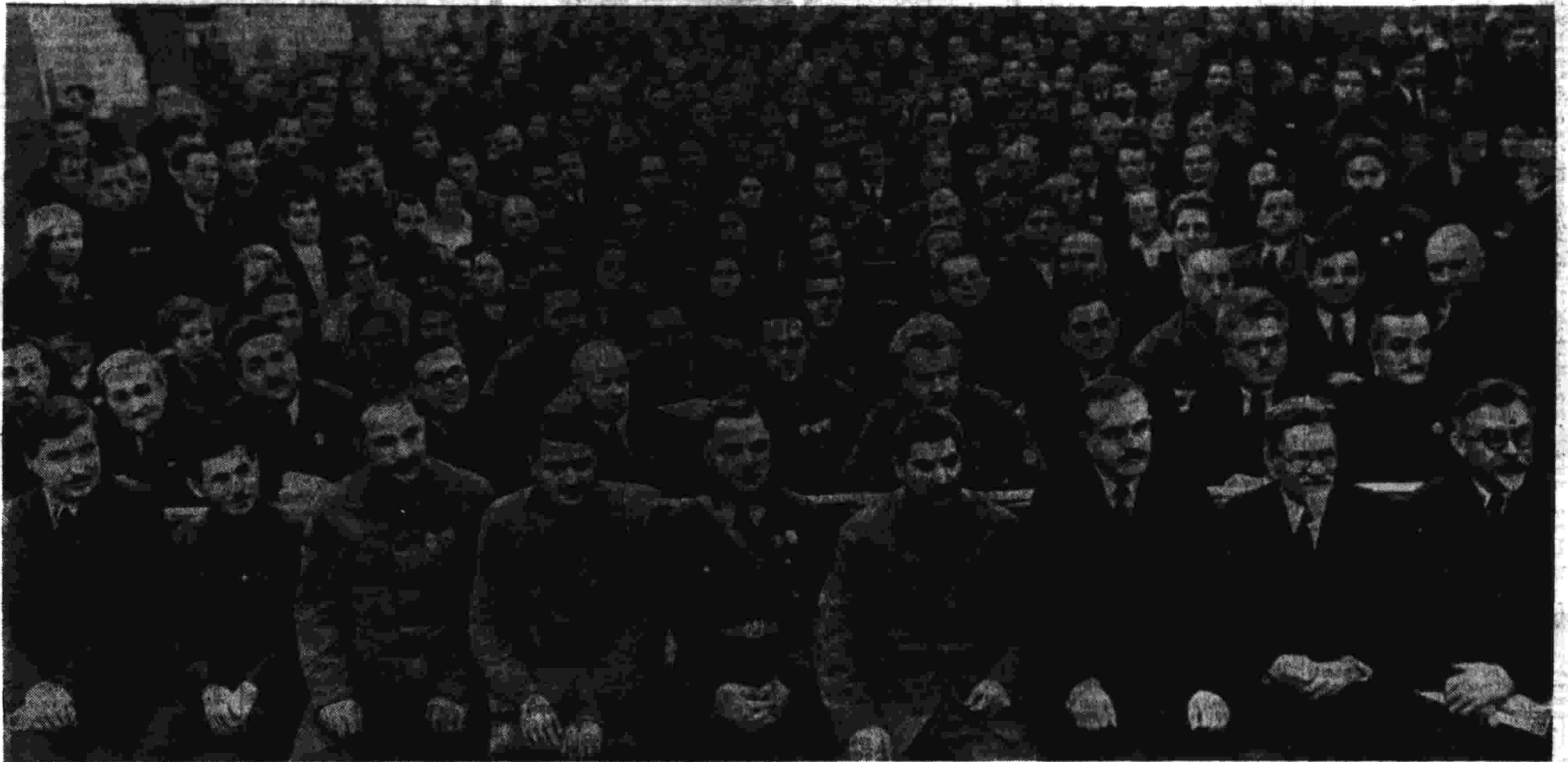
Товарищи Чубарь, Ежов, Каганович, Жданов, Ворошилов, Сталин, Молотов, Калинин, Петровский, Косиор среди делегатов Чрезвычайного VIII Съезда Советов от Украинской ССР.

С огромным воодушевлением встречает советский народ Сталинскую Конституцию. Под знаменем партии Ленина-Сталина, вперед, к новым победам коммунизма!