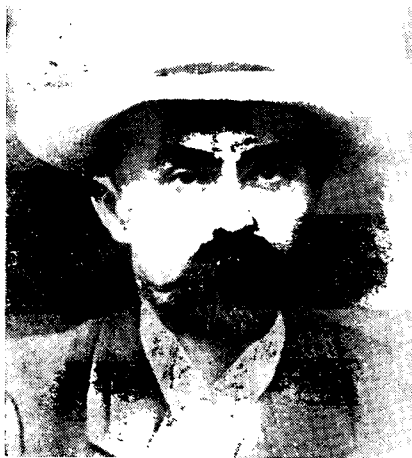
Г. В. ПЛЕХАНОВ

путь марксизма переходит группа видных русских революционеров-народников во главе с Г. В. Плехановым, которая создает в 1883 г. в Женеве первую российскую марксистскую организацию — группу «Освобождение труда».