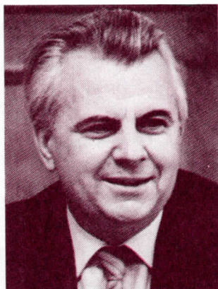
Секретарь ЦК Компартии Украины Леонид Кравчук

ХОРОШО ИЗУЧИВ ПРОГРАММНЫЕ ДОКУМЕНТЫ РУХА, Я ПРИШЕЛ К ВЫВОДУ, ЧТО В ЛИЦЕ ЭТОЙ ОРГАНИЗАЦИИ МЫ ИМЕЕМ АЛЬТЕРНАТИВНУЮ СИЛУ КОМПАРТИИ РЕСПУБЛИКИ