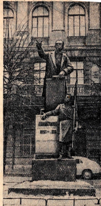
Памятник Г. В. Плеханову у Технологического института в Ленинграде.

В течение нескольких лет Плеханов руководил кружками, писал прокламации. Спасаясь от преследований царизма, он вместе с другими революционными народниками эмигрировал за границу, где в 1883 году вместе с Засулич, Аксельродом и другими организовал — в Женеве — первую русскую марксистскую группу «Освобождение