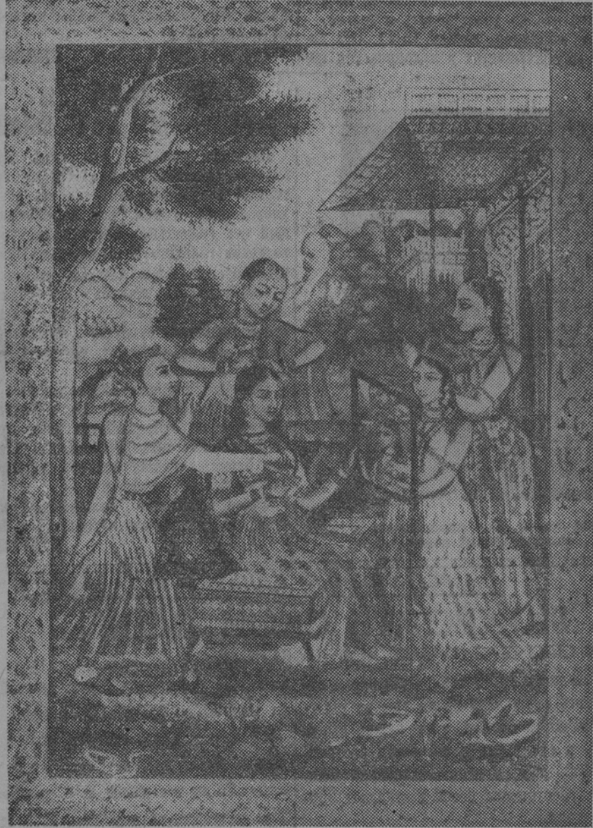
Миниатура из персидской рукописи