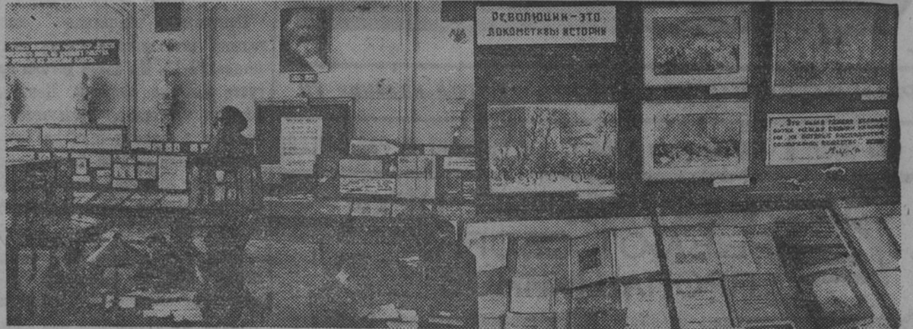
Специальные выставки по вопросам политики, техники, литературы и истории знакомят посетителей со всей литературой, имеющейся по данному вопросу.

Впрочем, некоторые уступки крепили сердце чиновным библиотекарям пришлось сделать. Молодому русскому капитализму требовались квалифицированные кадры интеллигенции: врачи, инженеры, педагоги. Читальный зал, вновь открытый в 1862 г., пропустил спустя 12 лет после своего открытия — 120.508