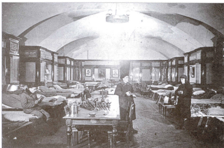
Сотрудники Библиотеки на казарменном положении. Зима 1941—1942 гг.