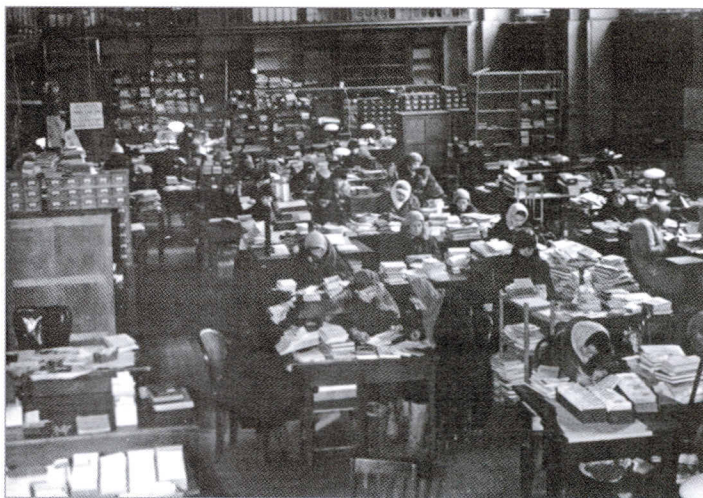
Обработка поступивших бесхозных библиотек. Зима 1943—1944 гг.

чьей-то рукой календарными днями страшного декабря 1941 года. Эти и многие другие материалы стали уникальным памятником героям-ленинградцам. Годы блокады Ленинграда — тяжелый, во многом трагический, но вместе с тем героический период в жизни Публичной библиотеки. Беспримерен подвиг ее сотрудников, не только переживших вместе с городом суровые блокадные годы, но сохранивших Библиотеку для будущих поколений и своим мужеством подерживавших веру в победу в душах своих читателей.