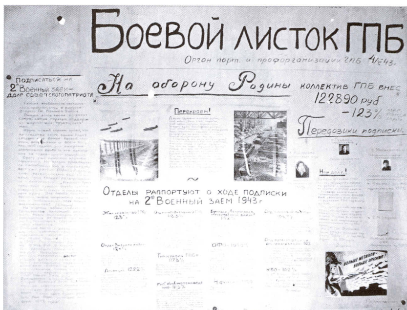
Стенгазета «Боевой листок ГПБ». (публикуется впервые)

всякую жизнь в Ленинграде, помогало труженикам Библиотеки перенести все тяготы блокады.