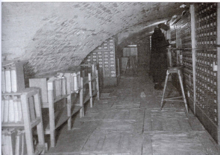
Каталоги Библиотеки, перемещенные в подвал. Зима 1941—1942 гг.

ступеням медленно спускаешься в подвал на уровне бомбоубежища, где хранятся ценнейшие каталоги Библиотеки. В одной руке — читательские требования и списки книг по разным заданиям, в другой — ключ и зажженный фонарь. Мороз обжигает пальцы, поворачивающие — ключ в замке. Двери раскрыты. Холод, мрак и одиночество охватывают тебя со всех сторон. Низкие, массивные каменные своды. Фонарь слабо освещает выдвинутый столик каталога, на который с трудом извлекаешь разбухший ящик с карточками. <...>