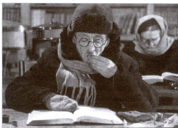
В читальном зале Библиотеки. Зима 1941—1942 гг.

Только за годы блокады Публичную библиотеку посетили 9 тыс. 229 читателей, которым было выдано 502 тыс. 867 книг, журналов, газет и других материалов [6, с. 297]. Самая большая доля приходилась на военных специалистов, врачей, медсестер, политработников армии и флота — более 40% читателей. Обращались в Библиотеку пропагандисты и агитаторы, инженеры и рабочие, педагоги и учащиеся, научные работники, журналисты и литераторы, артисты, художники, архитекторы — люди самых разных профессий. Читателям требовались материалы, необходимые для решения задач, связанных с обороной города: о ведении уличных боев, строительстве оборонительных сооружений, оборудо-