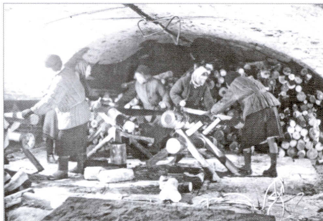
Заготовка дров сотрудниками для Библиотеки. Зима 1943—1944 гг.

В мае 1942 г. коллектив Публичной библиотеки направил из осажденного Ленинграда вызов на социалистическое соревнование коллективу Государственной библиотеки СССР