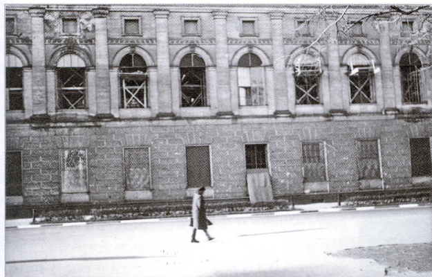
Фасад здания Библиотеки. Зима 1942 г.

Вот как вспоминали об этом сами очевидцы: «Крепко стояло старое прочное здание, только глухо потрясаясь от страшных ударов, но стекла не раз вылетали и рассыпались вдребезги. Тогда холодный ветер врвался в разбитые окна, свободно и нагло гулял под сводами величественных зал, вздувая темные шторы и пронизывая насквозь маленькую кучку стойких библиотекарей фонда. Поднимаясь на высокие галереи, коченеющими руками они снимали для читателей нужные книги. Слабые и голодные, они не уходили до тех пор, пока дневное задание не