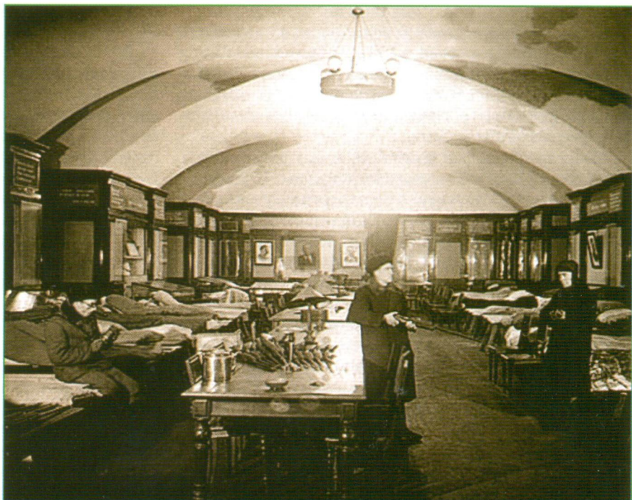
Сотрудники ГПБ на казарменном положении (зима 1941–1942 гг.)

Очень большое значение в военное время имела массовая работа. Основным содержанием мероприятий стала пропаганда материалов о подвигах на фронтах и трудовом героизме рабочих, колхозников и интеллигенции. Всего за годы войны было организовано