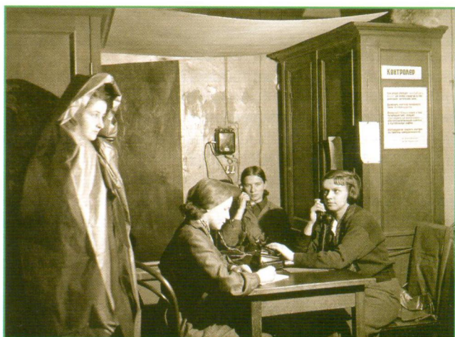
В штабе МПВО ГПБ

всемирной литературы (IV филиал). И хотя число читателей в ней было невелико (в 1942 г. — 359 человек, в 1943 г. — 459, в 1944 г. — 1307, в 1945 г. — 2634), все они получили полноценное библиотечное обслуживание 1 .