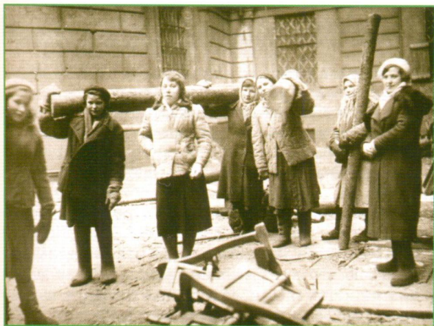
Заготовка дров (1942 г.)