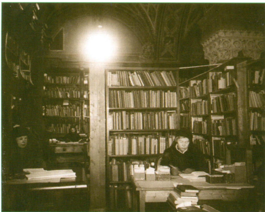
Общий читальный зал в Кабинете Фауста (зима 1941–1942 гг.)

В 1943 г. условия работы немного изменились к лучшему: стала поступать электроэнергия, отапливалась часть помещений. В этом году сотрудники библиотеки провели работы по упорядочению подсобных фондов, которые в результате многократных перемещений были разбросаны в нескольких местах. В этом же году возобновилось поступление изданий из Москвы, где накапливались обязательные экземпляры разных регионов СССР. Первый вагон с изданиями прибыл в Ленинград 1 ноября 1943 г., что стало важным событием в жизни Библиотеки.