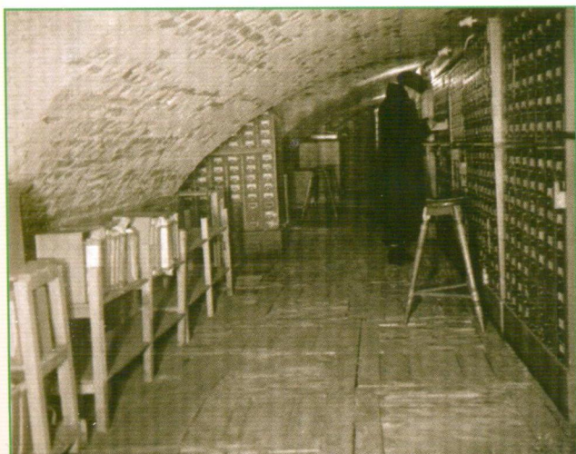
Каталоги библиотеки, перемещенные в подвал (зима 1941–1942 гг.)

В письмах читателей с фронта, публиковавшихся в газетах военных лет, можно найти свидетельства того, как же велик был авторитет «Салтыковки»: «Дивизионный инженер, гвардии майор Яншек пишет: