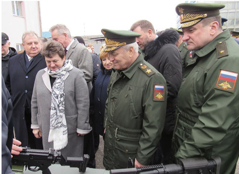
диций отцов и дедов.