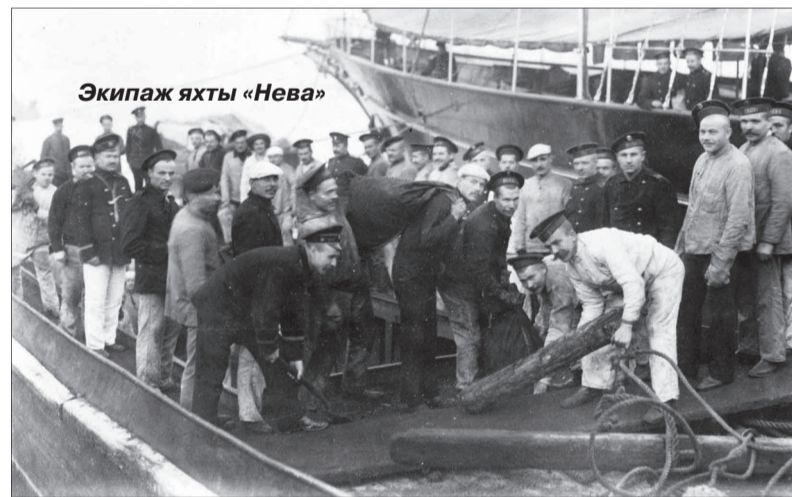
Экипаж яхты «Нева»