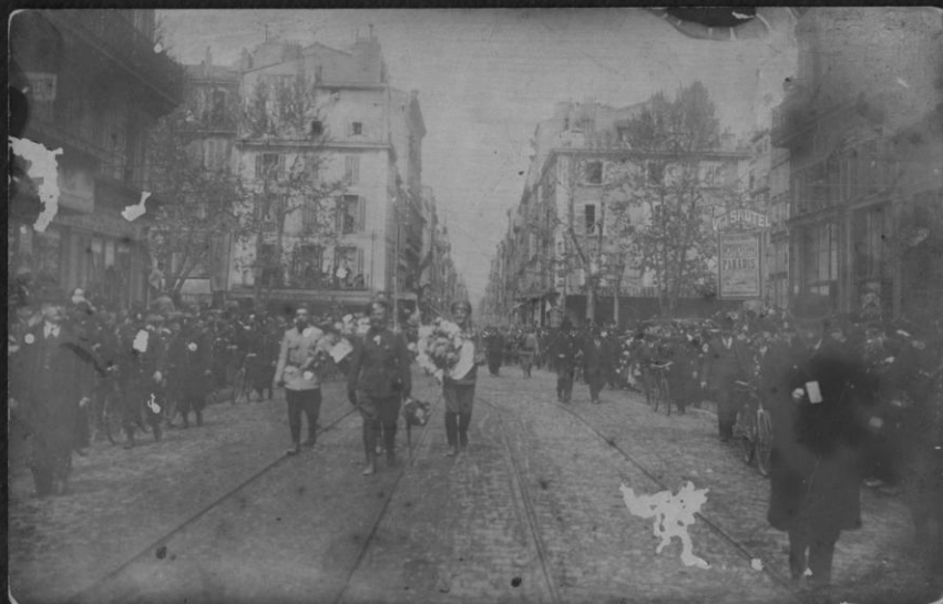
Встреча 1 бригады в Марселе. 20 апреля 1916 г.