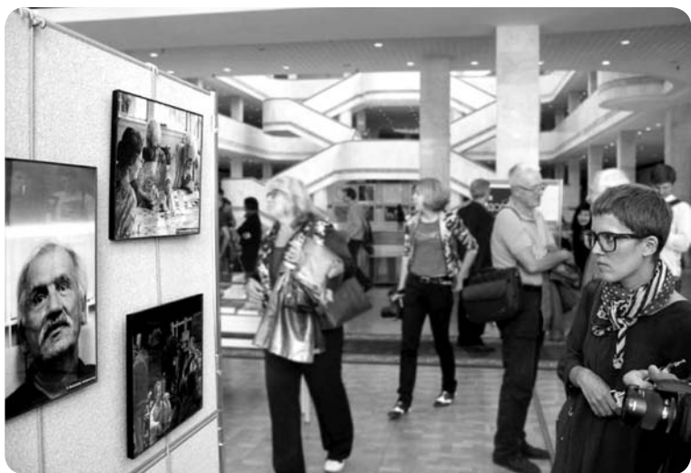
На открытии выставки