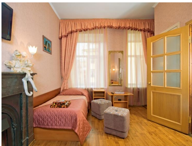
Фото "одноместного стандарта":