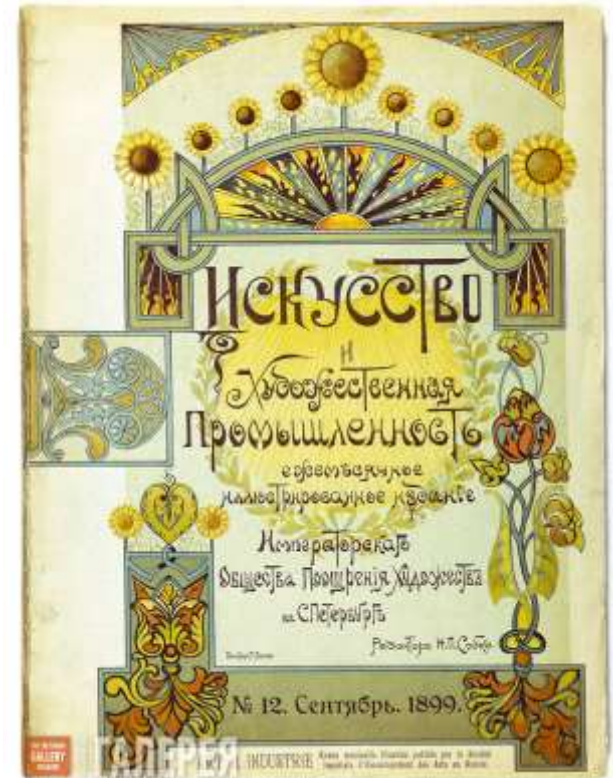
«Искусство и художественная промышленность»