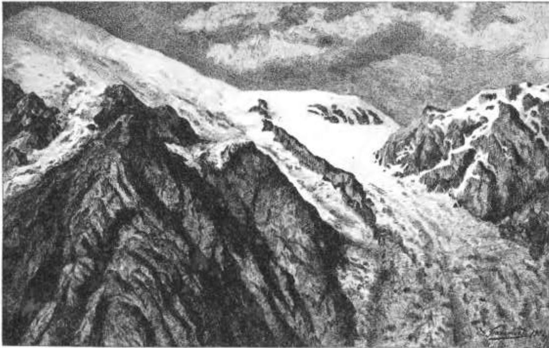
Девдоракский ледникъ. Общій видъ. Унив. рис. (гобета «Нивы») Д. А. Пахомова, лит. «Нивы».

Пахомов Д. Девдоракский ледник // Нива. 1901. № 30. С. 506-508.