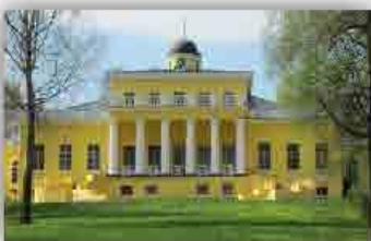
Воспоминания участников поэтических праздников прежних лет