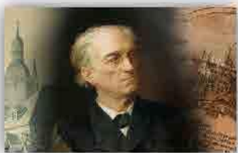
Поэтический онлайн-марафон «О слово русское, родное!»