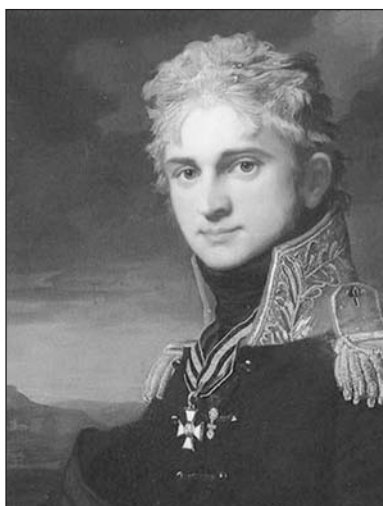
Граф П.А. Строганов

том; множество рогатого скота, отбитого у неприятеля, досталось при сем случае в добычу храбрых казаков» 4 .