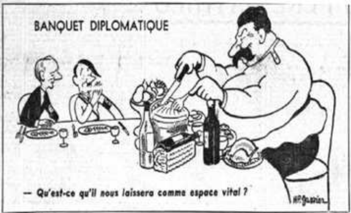
ДИПЛОМАТИЧЕСКОЕ ПИРШЕСТВО Что он оставит нам в качестве жизненного пространства?