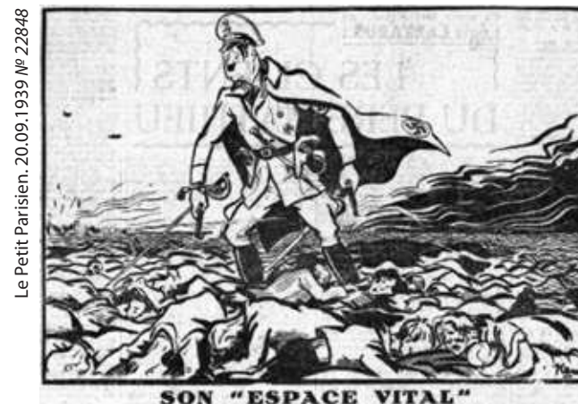
SON "ESPACE VITAL" ЕГО «ЖИЗНЕННОЕ ПРОСТРАНСТВО»

Отдельно стоит сказать о карикатурах, которые публиковались на страницах французских газет (см. Приложение 4). Они достаточно наглядно демонстрируют общее отношение современников к рассматриваемым событиям. Безусловно, политическая сатира начального этапа Второй мировой войны требует отдельного исследования, мы же попытались подобрать наиболее характерные карикатуры августа-сентября 1939 г. Кроме того, нам бы хотелось отметить весьма любопытное издание «Русские и поляки глазами друг друга: Сатирическая графика» (Иваново, 2007), которые может быть интересно всем исследователям российско-польских отношений.