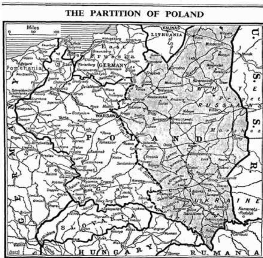
The broken line marks the boundary agreed upon by the Soviet and German Governments. The shaded area shows the part of Poland to be left in Russian hands.