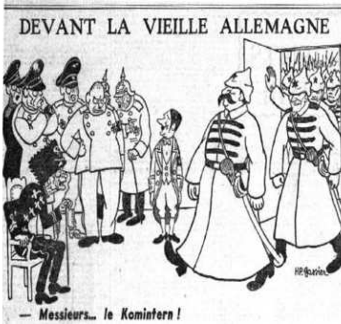
ПЕРЕД СТАРОЙ ГЕРМАНИЕЙ Господа... Коминтерн!