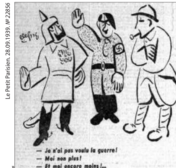
— Я не хочу войны! — Я тоже! — А я еще меньше!..