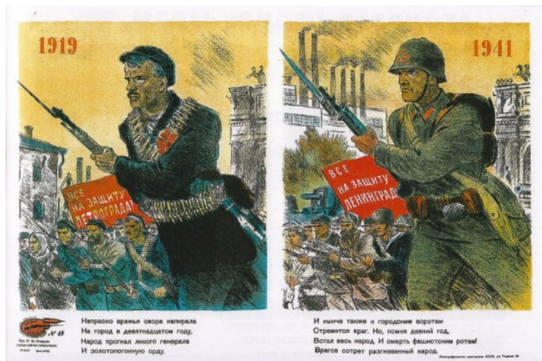
Ил. 5. Плакат 1919–1941. Все на защиту Петрограда!

Через год политическая ситуация изменилась, и победа над Юденичем использовалась уже для поднятия духа защитников города. Особенно часто его вспоминали в августе–сентябре 1941 г., сравнивая оборону города с ситуацией 1919 г. Так, появился плакат, изображающий рабочего с винтовкой в 1919 г. и красноармейца 1941 г. со стихами (ил. 5):