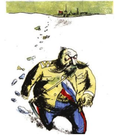
Ил. 2. Карикатура «Кукрыниксов»

Статья снабжена известной карикатурой Кукрыниксов, изображающей Юденича, скачущего на коне из-под стен Петрограда (ил. 1). Это не единственная карикатура знаменитого коллектива художников на генерала. В журнале «Крокодил» в 1937 г. вышла серия карикатур на белых генералов «Кого мы били», снабженная юмористическими стихами