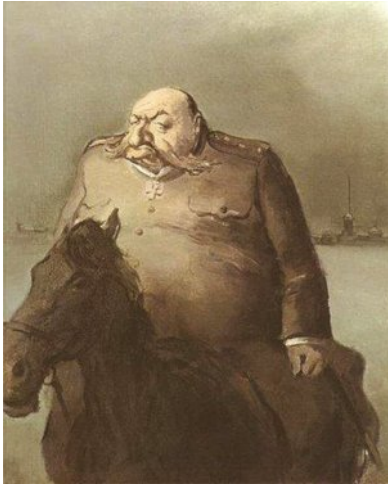
Ил. 1. Карикатура «Кукрыниксов»

по мутным волнам белой эмиграции, по кабацко-монархистским «штабам» и притонам. Собачьей смертью умер антантовский лакей, чьи белые банды 14 лет назад были разбиты и рассеяны под красным Питером 20 .