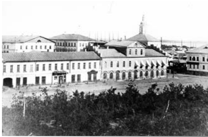
Губернаторская площадь с видом на здание Общественной библиотеки

ний для так называемой Губернской выставки (ставшей впоследствии первым Губернским Музеумом) и для Публичной библиотеки, привлечения финансов, приобретения книг и журналов, подбор персонала и т. д. и т. п., вплоть до занавесей в помещении библиотеки.