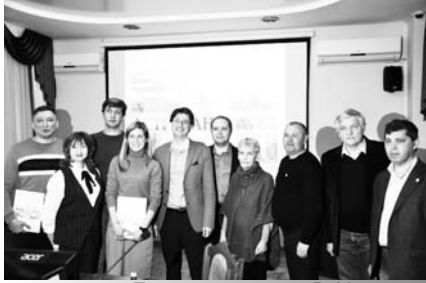
Презентация книги В. Манькова

нию накопленные знания в этой области. В 2018 г. состоялись презентации книг астраханских авторов, посвящённых историческому прошлому города. В фотоальбоме «От «Модерна» до «Октября»» писателя-краеведа Владимира Петрушкина собраны редкие фотографии первого в России по красоте и изяществу грандиозного электрического театра «Модерн». Благодаря малоизвестным фактам и богатейшему иллюстративному материалу, издание ин-