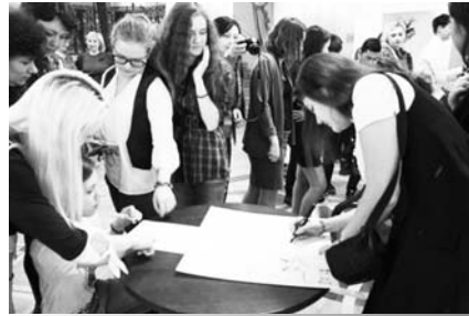
Живые театральные уроки

вызывали положительную реакцию у жителей города. Партнёрство с магазином «Мел и уголь» обеспечило связь с творческим астраханским сообществом,