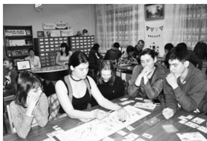
Игротка. Игра по мотивам японской культуры

ничества ведут исследования лингвистической настольной игры на предмет актуальности использования в культурно-образовательном мероприятии, изучают механику игр, осваивают навыки работы игромастера. С учётом потенциала и возможностей партнёра, разработаны и реализуются сценарии с использованием настольных игр как на плановых (лингвострановедческие гостиные), так и на масштабных мероприятиях (акции «Библионочь», «Пришло время читать»). Связь с литературой устанавливается через проведение тематических игротек, так, например, в 2017 г. в рамках всероссийской акции «Библионочь» была проведена игротка «Игры народов мира», включающая настольные игры, основанные на произведениях Алексея Толстого, Жюль Верна, Александра Дюма, Джорджа