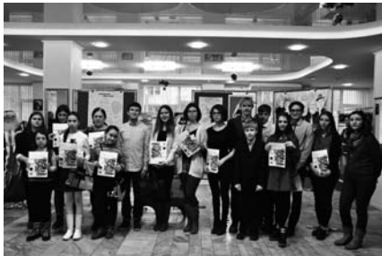
Конкурс «Книги и намерения». Участники

стала популяризация книги и культуры чтения с помощью средств визуальной культуры. В данном случае партнёрство заключалось не только в непосредственном проведении мероприятия, но и в знакомстве аудиторий посетителей каждого из партнёров: привлечении в библиотеку новых читателей и творческой молодёжи, информировании читателей библиотеки об интересном представителе малого бизнеса. Как это часто бывает при частно-государственном партнёрстве, магазин полностью