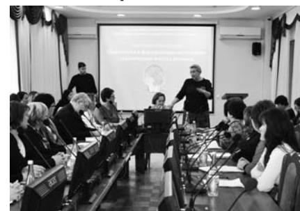
Творческая лаборатория «Библиотека в формировании позитивного туристического имиджа региона»