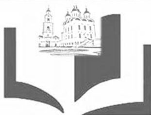
День православной книги в Астраханской области

Неотъемлемой частью «Дней» стали выставки художественного творчества, знакомящие с талантливыми астраханскими авторами, выездные программы в районы области с участием местных культурных, образовательных сообществ и духовенства. Сформировались прикладные элементы, сопровождающие мероприятия: фильмы, музыкальные произведения, живопись, фотографии. В 2012 г. появилась хорошая традиция завершать встречи по открытию дней выступлением клиросного хора Иоанно-Предтеченского мужского монастыря.