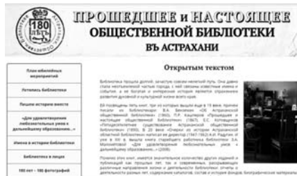
Интернет-страница «Прошедшее и настоящее общественной библиотеки в Астрахани»

дей, работавших в разные годы в библиотеке, выяснению ранее неизвестных фактов, неразрывно связанных с историей библиотеки.