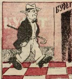
1 ход: Пошел пешкой...