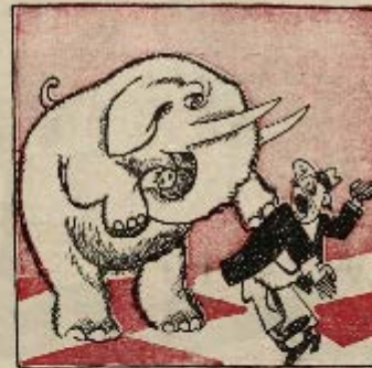
6 ход: Протканик лоник белым-белый!!! Мне шах!