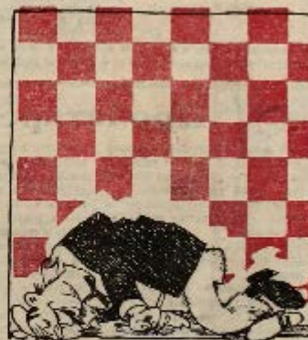
8 ход: Мат королю!