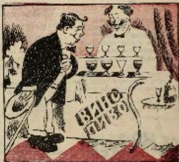
2 ход: Глажу, соглот болше пешки. Остал бити.