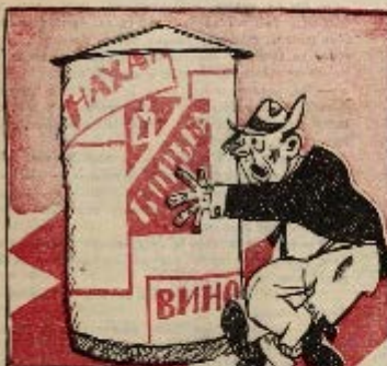
5 ход: Тафу ты хор! Бова! тури на поресе-не лает проходу, прохлалат...