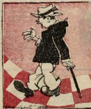
3 ход: Кожна! пешка!