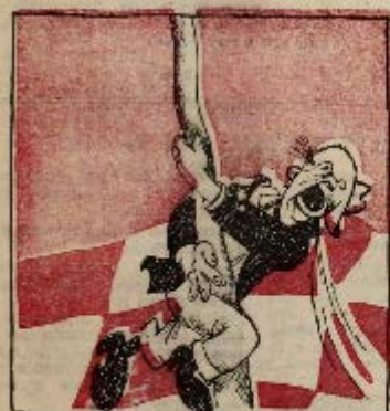
7 ход: Хажу хоралки во круг оси.