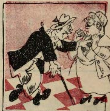
4 ход: Обжма шах прохладцей королева.