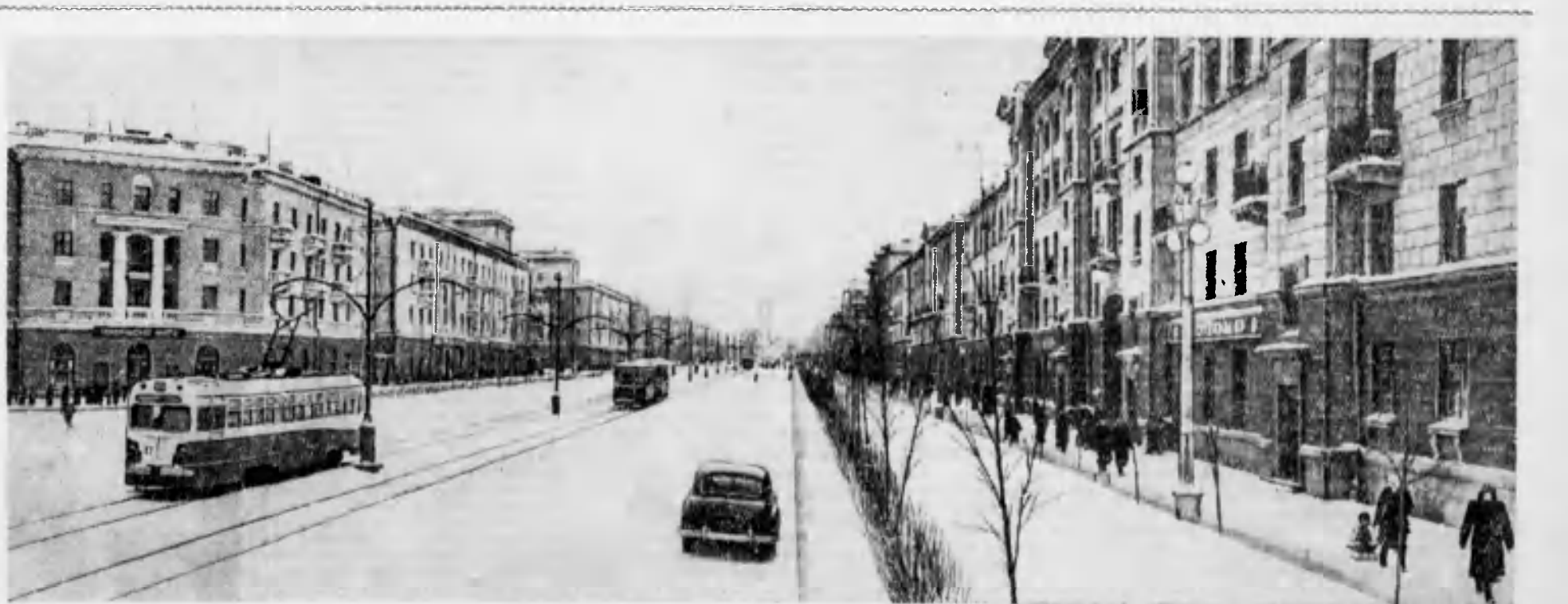
С каждым годом хорошеет город потомственных металлургов — Нижний Тагил. Среди заснеженных уральских елей вырастают целые кварталы жилых домов, новые улицы, культурно-бытовые предприятия. За по-