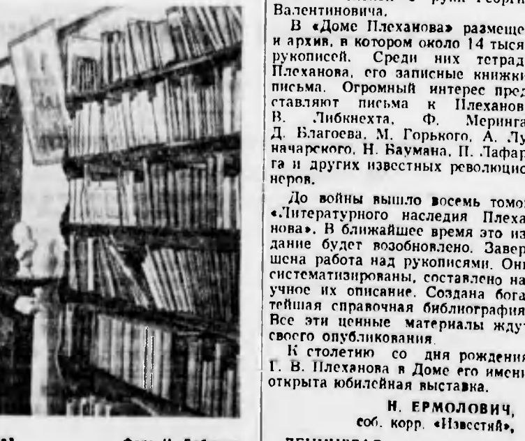
Посетители в кабинете Г. В. Плеханова.