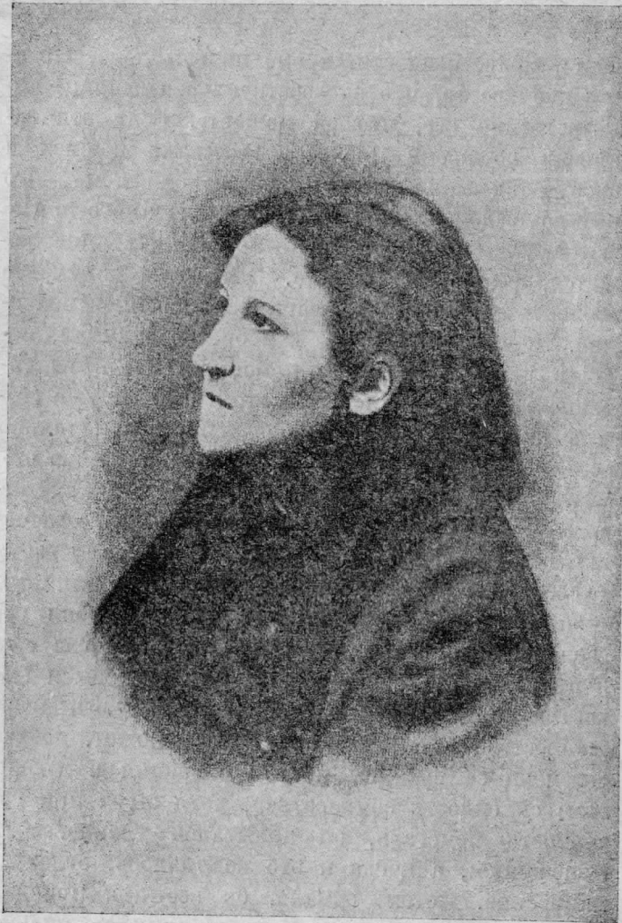
В. И. Засулич в ссылке по Нечаевскому делу.

Таким образом началась ее бродячая поднадзорная жизнь. У нее делались бесконечные обыски, ее задерживали, арестовывали. Но это только еще более закаляло ее революционную энергию, волю к борьбе и противодействиям. Она крепла и мужала в положении затравленного волка. Она почувствовала с этих пор бесповоротно, что ее жизнь целиком принадлежит революции и народу. И она в душе благословляла тот день и час, когда она впервые в Петербурге встретилась с революционной средой в лице Нечаева и его товарищей.