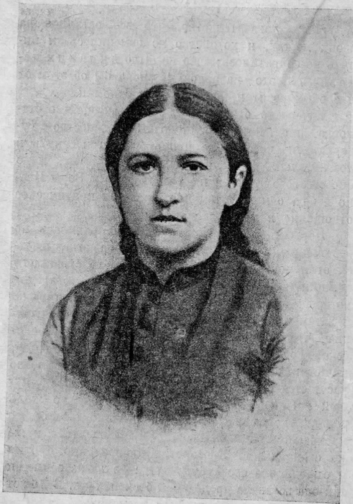
В. И. Засулич (17 л.) до Нечаевского процесса.

И дальше, в том же дневнике, В. И. пишет, «как началось это приобретение будущей жизни на земле». «Постепенно, издавна, черта за чертой складывалась она передо мной, далекая, еще неясная в сияющем тумане, но несомненная для меня. Мне кажется, что лично меня толкало жадно ловить все, что говорило о каком-то будущем. Мое отвращение от будущего, которое сулили мне сложившиеся общественные отношения, о которых упоминалось в Биколове (деревня, где воспитывалась В. И.) — гувернантка (т.-е. стать гувернанткой). Все, что угодно, только не это... Еще до революционных мечтаний, даже до пансиона (В. И. из Биколова лет 15 отвезли в Москву, где поместили в частный пансион), я строила глупые планы, как бы мне избавиться от этого (чтобы не стать гувернанткой). Мальчику в моем положении было бы, конечно, легче, для его планов будущего широкий простор. И вот этот далекий призрак революции сравнивал меня с мальчиком: я могла мечтать о «деле», о «подвигах», о «великой борьбе»... в стане погибающих за великое дело любви. Я жадно ловила все подобные слова в стихах, в старинных песнях: «скорее дадим друг другу руки и будем мы питать до гроба вражду к бичам земли родной». В стихах иногда, даже там, быть может, где в мыслях автора было другое, находила желательный для себя смысл, напр., у своего любимого Лермонтова, и, конечно, у