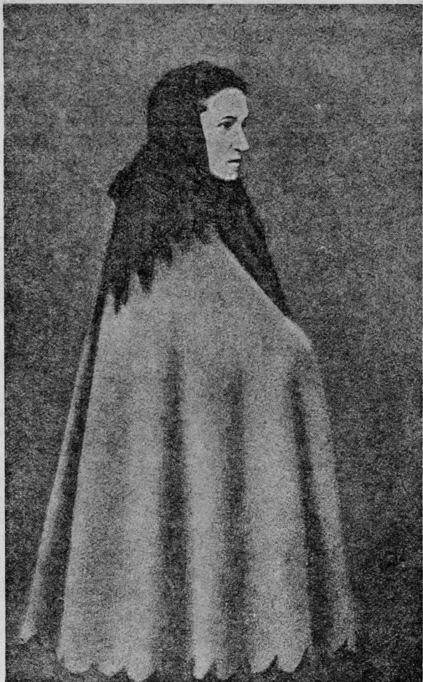
В. И. Засулич.