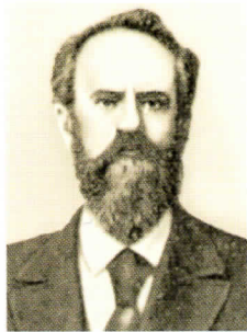
Дейч Лев Григорьевич

Д. мн. размышлял о взаимодействии совр. общественных, культурных норм со старыми, классич. традициями в иск-ве, искал их гармоничное сочетание. В годы Великой Отечественной войны 1941–45 художник выезжал на фронт, создал графическую серию «По дорогам войны» (1942) и ряд др. картин («Оборона Севастополя», 1942). В 1947 получил звание действит. члена АХ СССР. С 1947 Д. мн. работал как скульптор, использовал самый разнообраз. материал — дерево, майолику, бронзу, фарфор, цемент. В 1947–53 создал серию мозаик — портретов великих учёных для нового здания МГУ. В 1958 вернулся к преподаванию в Моск. госуниверсит. академич. художеств. ин-те им. В.И. Сурикова и вновь обратился к монументальному иск-ву: работал с мозаикой, а в 1960 стал гл. художником стр-ва Кремлёвского Дворца съездов. Ленинская пр. (1964).