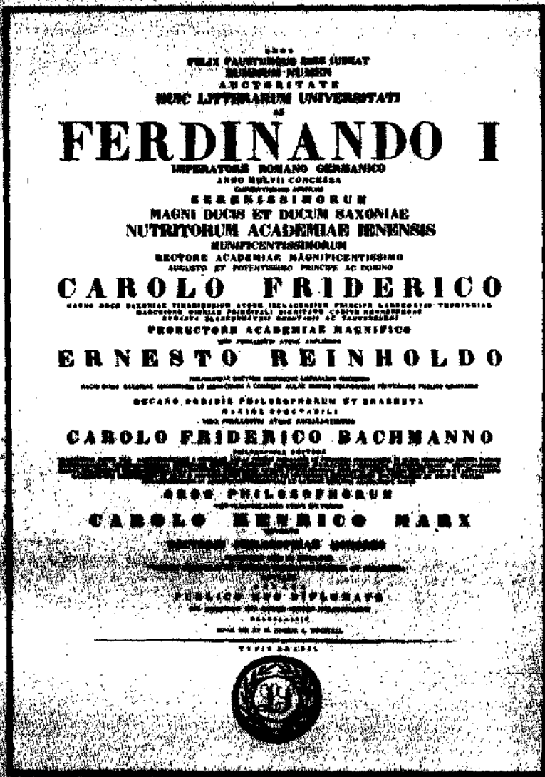
Диплом о присуждении Марксу ученой степени ДОКТОРА ФИЛОСОФИИ, выданный Йенским университетом 15 апреля 1841 г.