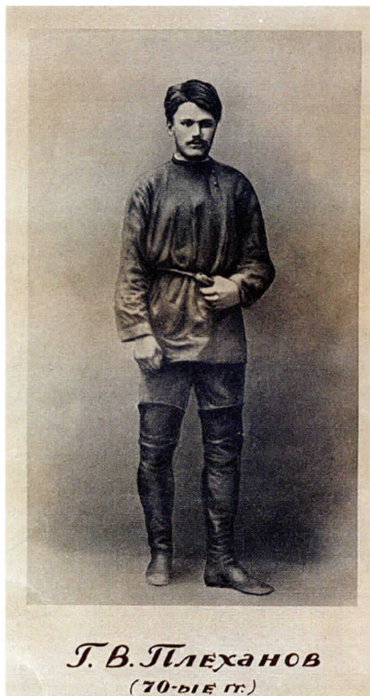
Г. В. Плеханов в одежде рабочего. 1877–1879 гг.

На рубеже 70–80-х гг. XIX в. в Петербурге было около 150 тыс. рабочих, на долю которых приходилась уже почти шестая часть населения столицы. Преобладали чугунолитейные, машиностроительные и военные заводы, а также текстильные фабрики. Положение рабочих было несколько лучше, чем в других городах, но и в Петербурге условия труда и быта рабочего человека стабильно оставались очень тяжелыми. Достаточно сказать, что рабочий день продолжался от 10 до 13, а на текстильных фабриках — от 13 до 15 часов. Рабочих буквально душили штрафы. В конце 70-х годов под влиянием экономического кризиса и депрессии свыше 20 тыс. петербургских рабочих потеряли работу. Ситуация усугублялась их полным политическим бесправием. В 1870–1880 гг. в Петербурге и его пригородах произошло около 90 стачек. Появился целый слой социально активных, грамотных рабочих, из которых вырастали пролетарские вожаки. Неудача «хождения в народ» подогрела интерес революционеров к городскому пролетариату, жившему ... довольно плотной, компактной массой и сравнительно легко поддававшемуся революционной пропаганде 1 .