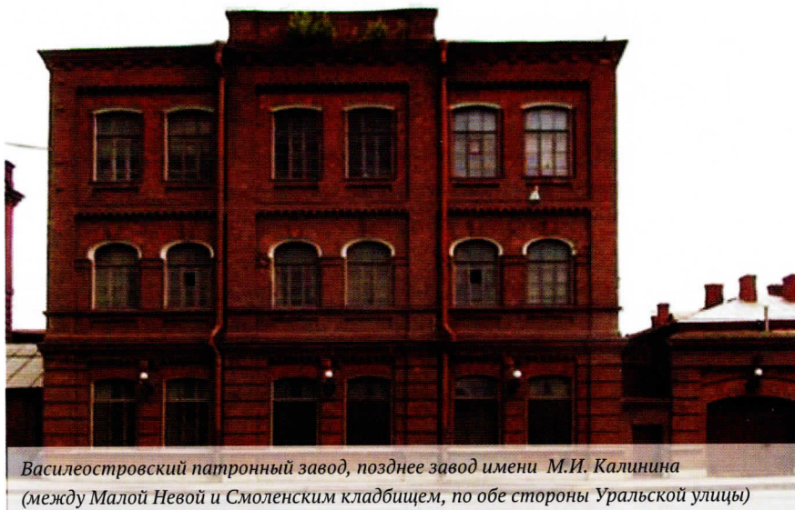
Василеостровский патронный завод, позднее завод имени М.И. Калинина (между Малой Невой и Смоленским кладбищем, по обе стороны Уральской улицы)