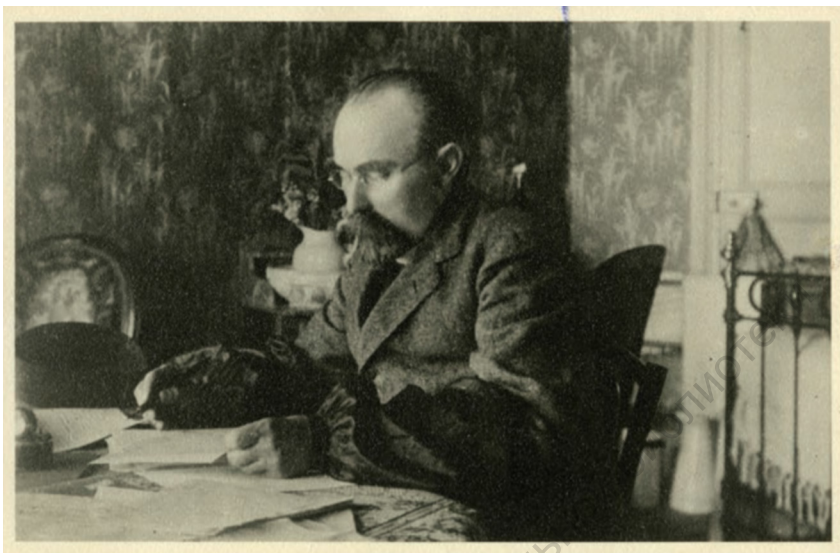
Г. В. Плеханов за работой в своем кабинете. [Сан Ремо. 1909–1910]. Фотография 9, 5 x 14, 5. АДП. Ф. 1093. Оп. 6. Ед. хр. 9. Л. 1.