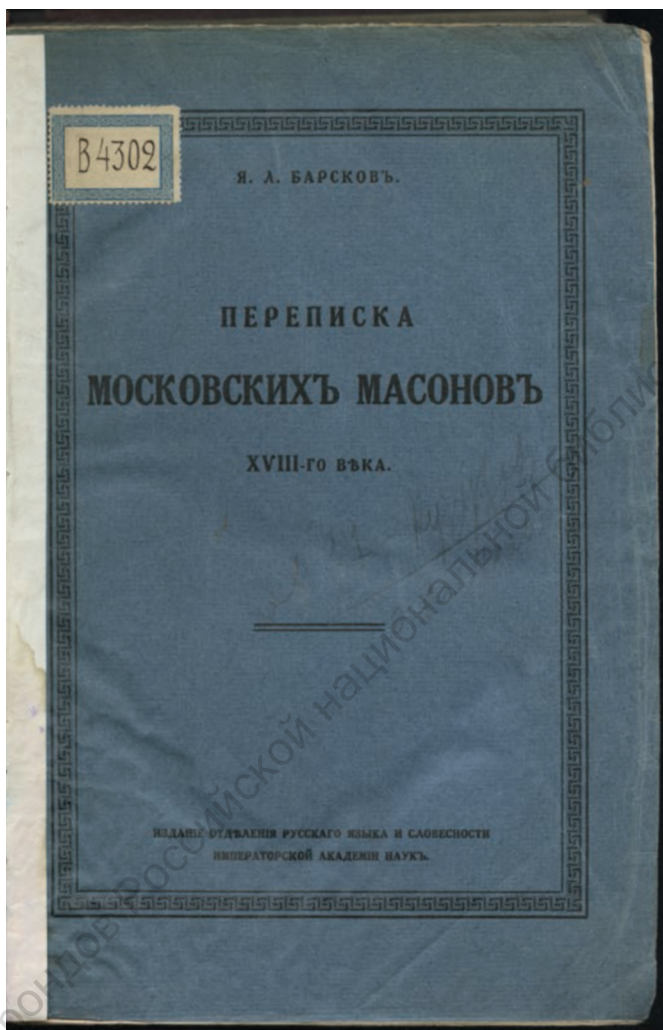
Барсков Я. Л. Переписка московских масонов XVIII-го века. Пг., 1915. Экз. из личной библиотеки Г. В. Плеханова. В 4302.