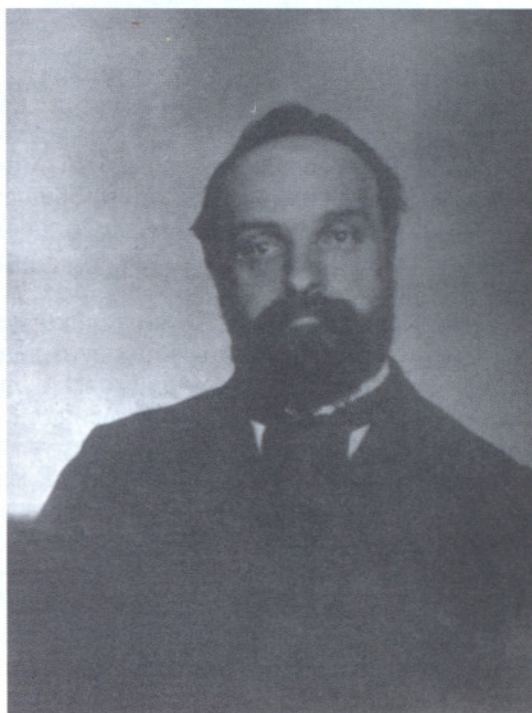
А.Н.Потресов. Фотография. РНБ АДП. Ф.1093. Оп.6. Ед.хр.463. Л.1