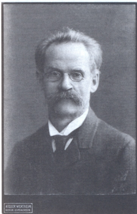
Л.Г.Дейч. Фотопортрет с дарственной надписью Р.М.и Г.В.Плехановым. Нерви. 4 апреля 1907 г. РНБ АДП. Ф.1093. Оп.6. Ед.хр.295. Л.3