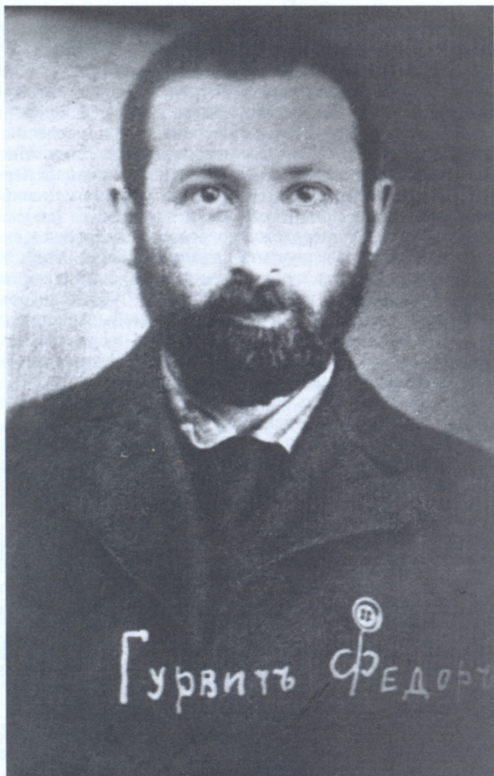
Ф.И.Дан. Фотография. РНБ АДП. Ф.1093. Оп.6. Ед.хр.292. Л.1