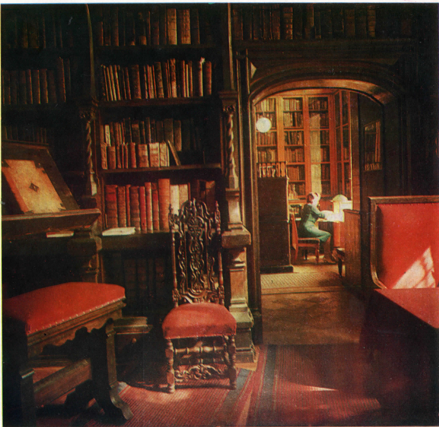
«Кабинет Фауста» (1857 г., арх. И. И. Горностаев). Здесь хранится богатейшая коллекция инкунабул.

Рукописный фонд Публичной библиотеки (более 370 тыс. еди-