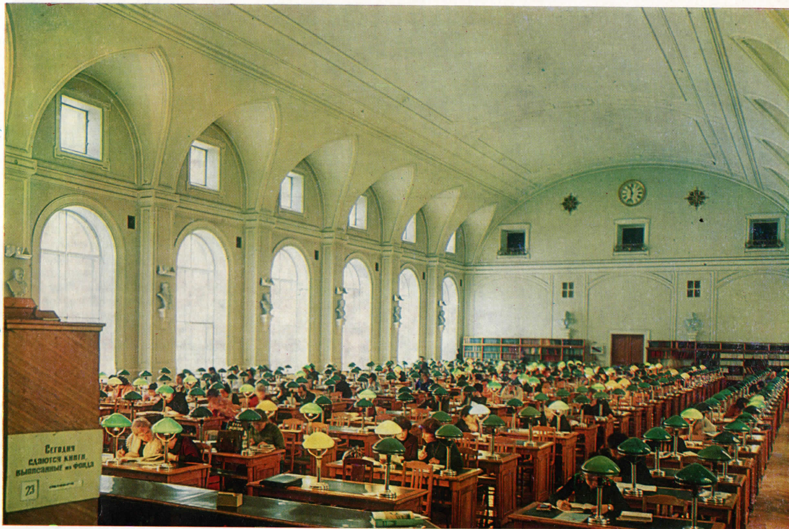
Научный читальный зал литературы по технике и медицине (1901 г., арх. Е. С. Вортилов).

ров страны в области библиотековедения, библиографии и книговедения. В общей сложности в научной работе участвуют более 400 специалистов, в числе которых около 80 кандидатов и докторов наук.