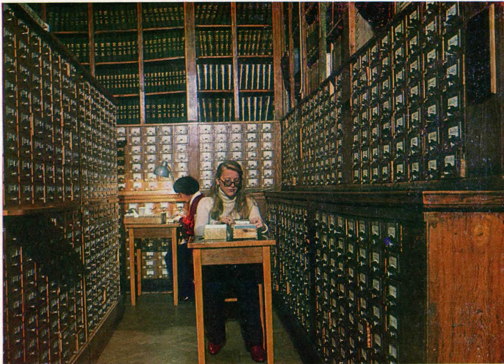
Читательский алфавитный каталог иностранной литературы.

теке экспериментальные работы по опытной эксплуатации автоматизированной информационно-поисковой системы на базе предметного каталога и по переводу части справочного аппарата на микрофиши.