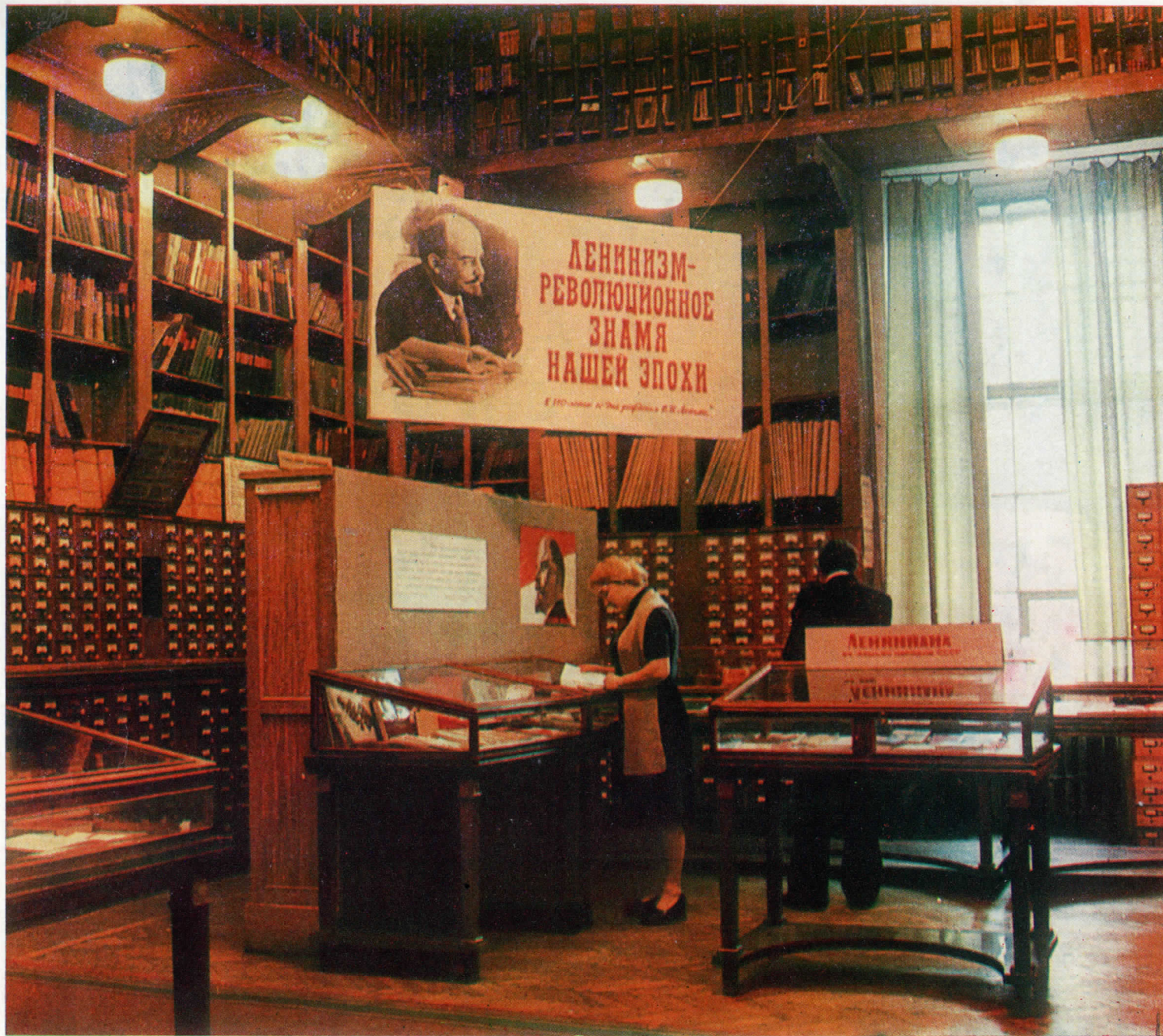
Книжно-иллюстративные выставки — действенная форма пропаганды книжных богатств, хранящихся в Публичной библиотеке.

более 70 названий научных трудов объемом более 600 авторских листов.