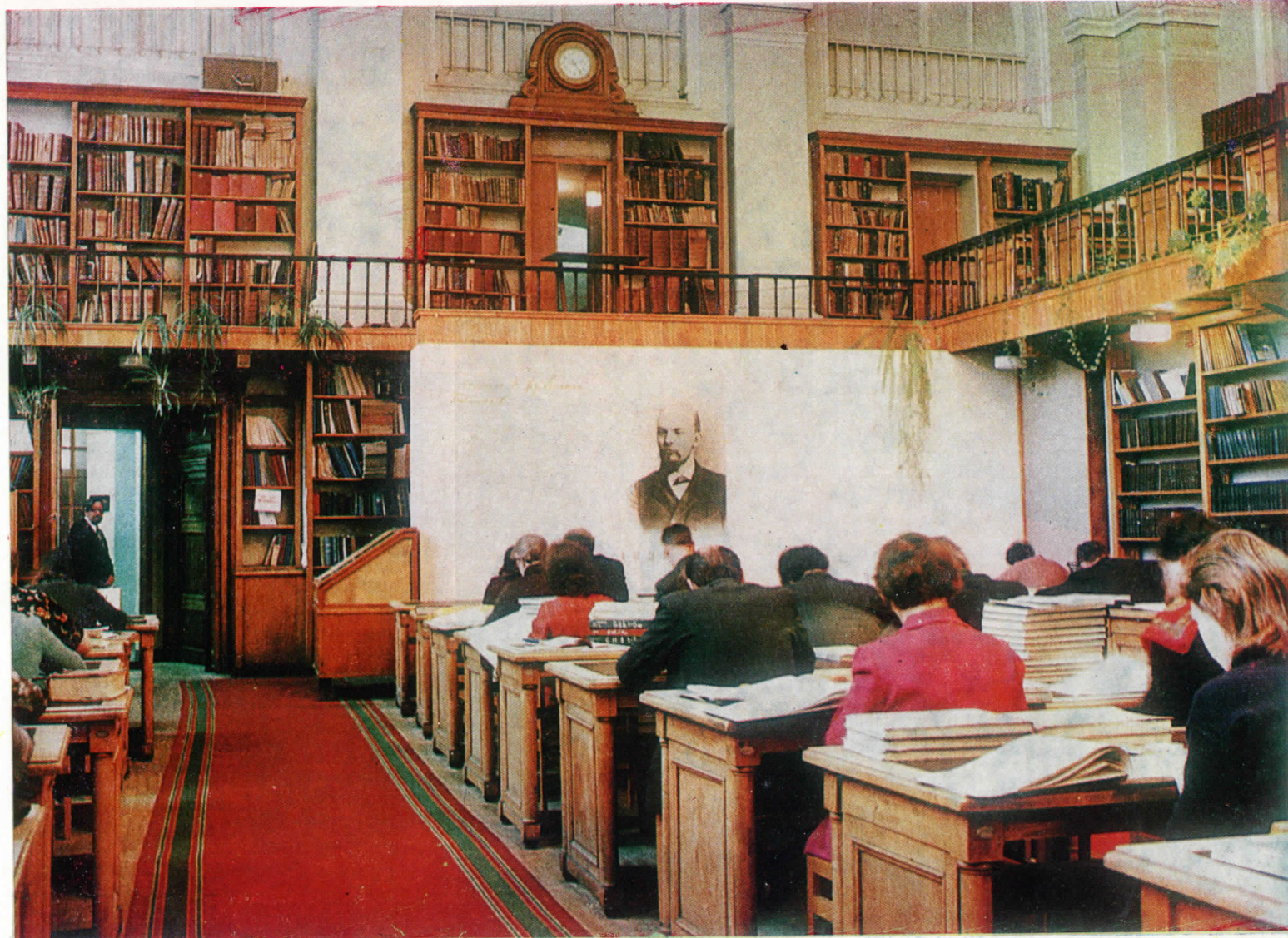
Ленинский читальный зал (1862 г., арх. В. И. Соболевский и И. И. Горностаев).

Библиотека — одно из памятных ленинских мест Ленинграда. На протяжении трех лет — в 1893—1895 гг. — В. И. Ленин регулярно работал в читальном зале библиотеки. Здесь же неоднократно происходили конспиративные встречи В. И. Ленина