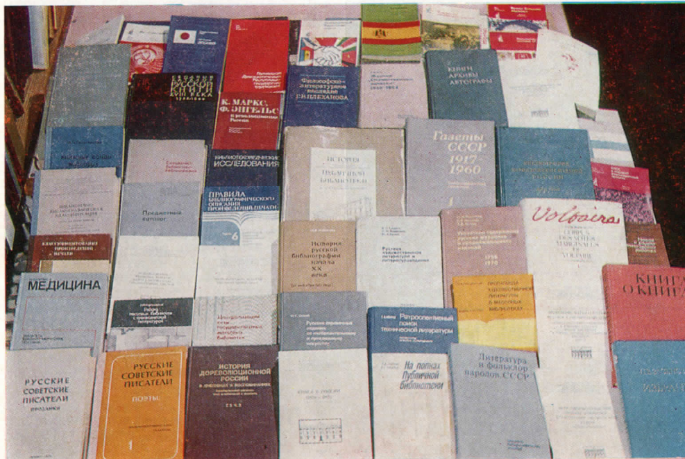
Издания, подготовленные сотрудниками Публичной библиотеки.

щие и специальные периодические издания и серии. В настоящее время Библиотека получает более 6 тыс. названий иностранных периодических изданий, из них свыше 2 тыс. технических. В дореволюционные же годы Библиотека получала всего лишь несколько десятков технических журналов.