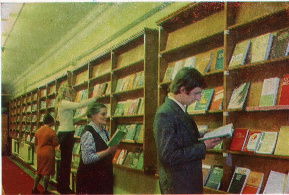
Выставка новых поступлений.