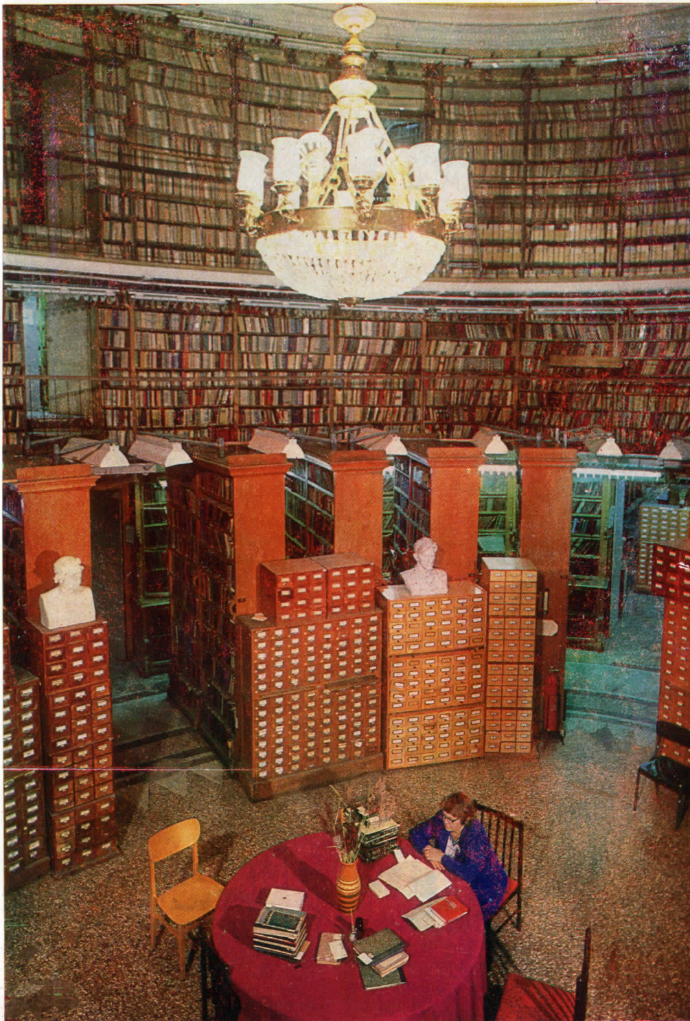
Овальный зал — центральное помещение первого здания библиотеки (1796—1801 гг., арх. Е. Т. Соколов). Здесь располагается Русский книжный фонд.

В 1939 г. за выдающиеся заслуги в области библиотечной работы и в ознаменование 125-летия со дня открытия Государственная Публичная библиотека была награждена орденом Трудового Красного Знамени.