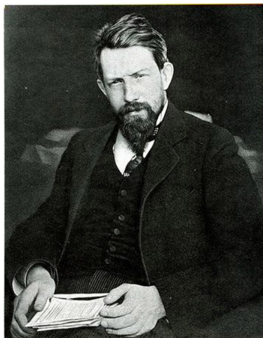
Пётр Бернгардович Струве (1870–1944 гг.), общественный и политический деятель, экономист, публицист, историк, философ.

Несмотря на ошибки Плеханова, его деятельность по распространению марксизма в России сыграла известную роль в создании рабочей социал-демократической партии.