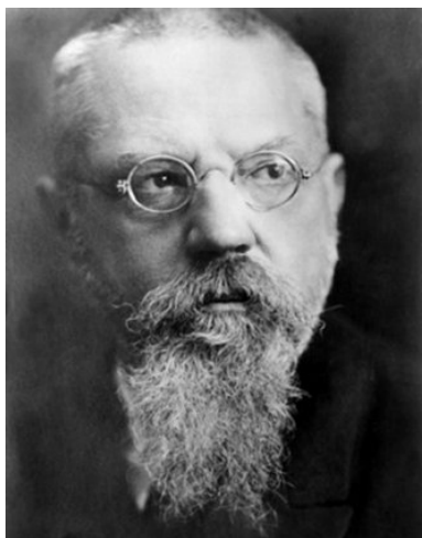
Михаил Николаевич Покровский (1868–1932 гг.), российский и советский историк-марксист, общественный и политический деятель. Лидер советских историков в 1920-е годы, «глава марксистской исторической школы в СССР».

Запада и напоминающие процесс развития великих восточных деспотий... Они то увеличиваются, то уменьшаются, вследствие чего Россия как бы колеблется между Западом и Востоком» 12 .