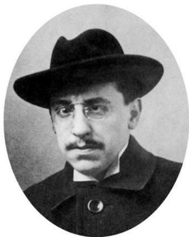
Разумник Васильевич Иванов-Разумник (1878–1946), русский и советский литературовед, литературный критик, социолог, писатель.

До известной степени эта работа Плеханова была ответом на книгу «критического народника» Р.В. Иванова-Разумника с аналогичным названием. Первое издание «Истории русской общественной мысли» Иванова-Разумника вышло в 1906 г. и имело большой успех (доказательством тому служат шесть последующих изданий). Ключевой идеей этой книги была история борьбы российской интеллигенции с мещанством. По мнению Иванова-Разумника, интеллигенция – это внесловная и внеклассовая часть общества, борющаяся за свободу личности, за свой индивидуализм. Ей противостоит мещанство, тоже внесловное и внеклассовое, которое стремится быть «как все».