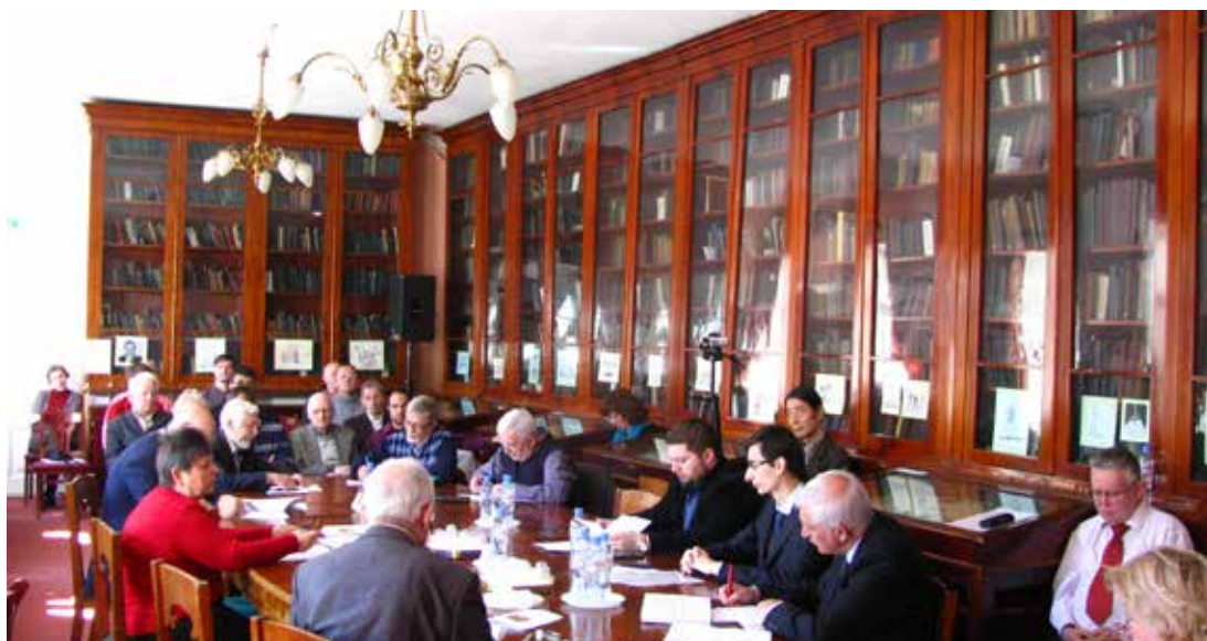
На заседании конференции

Участники конференции посчитали, что, применительно к историческому масштабу развития, Великая русская революция стала