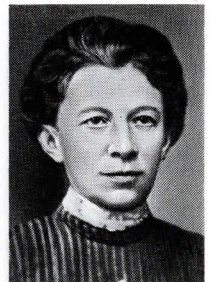
А. И. Елизарова-Ульянова.