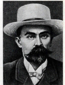
Г. В. Плеханов.