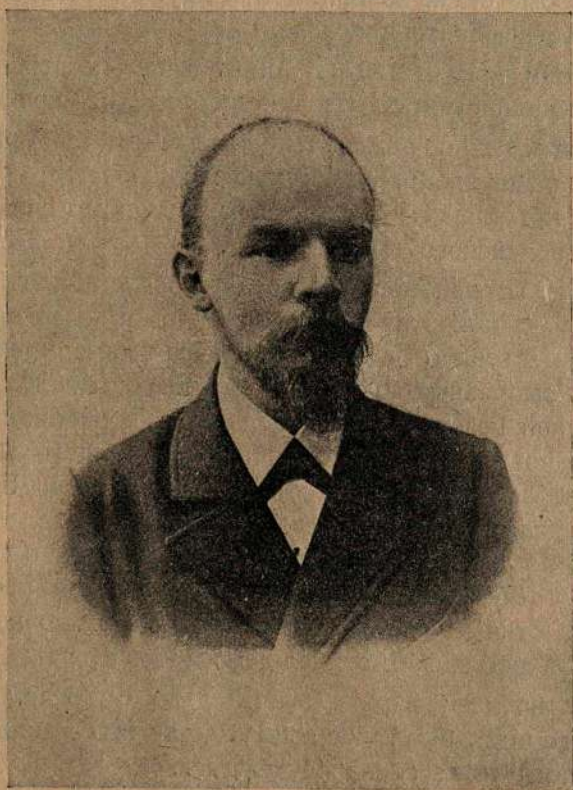
Рис. 10. В. И. Ленин в 1903 г.

капитализм, а с ним вместе будет расти рабочий класс. Потому главной задачей они считали хотя бы медленную, но упорную работу среди пролетариата : раскрывать рабочим глаза на их положение, организовать их в союзы и социалистическую рабочую партию для непрерывной борьбы с самодержавием и капитализмом.