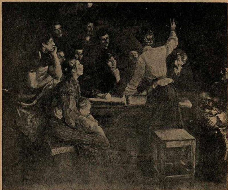
Рис. 9. Рабочий кружок.

Исходя из учения К. Маркса, группа «Освобождение труда» в противоположность народникам учила, что к социализму можно прийти не через крестьянскую общину с ее мелким хозяйством,