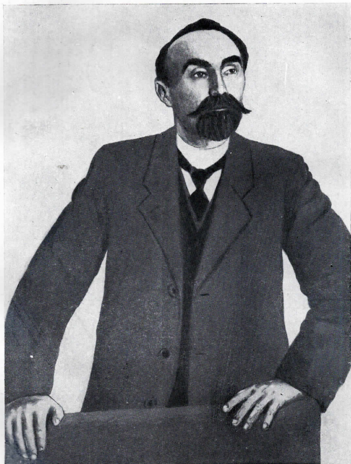
Г. В. Плеханов