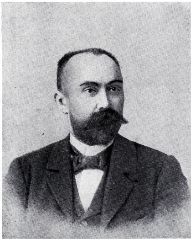
Г. В. ПЛЕХАНОВ