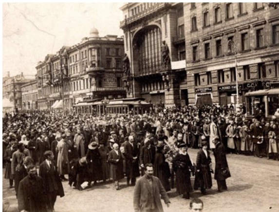
Похороны Г. В. Плеханова