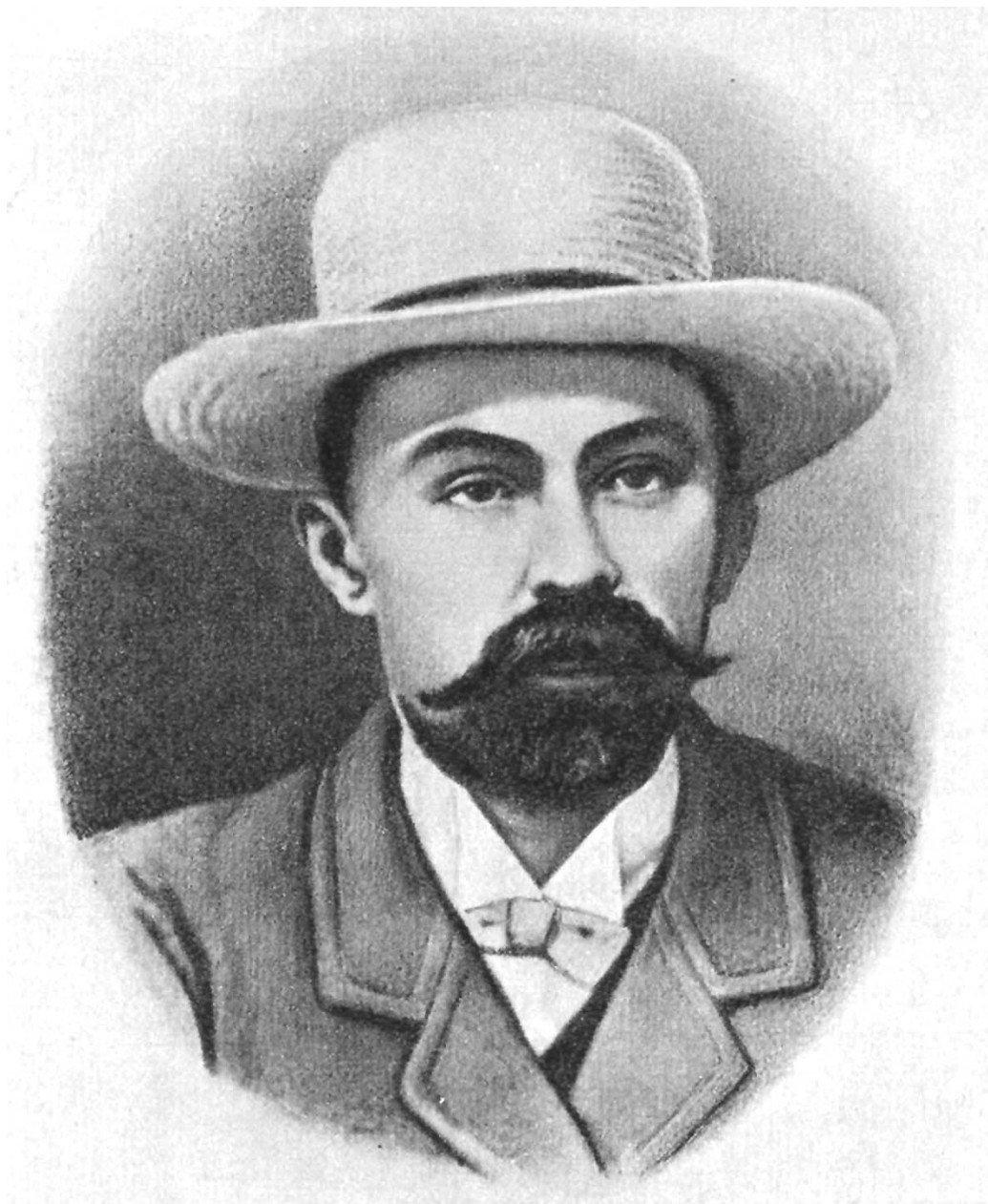
Георгий Валентинович ПЛЕХАНОВ (29 ноября 1856 г. – 30 мая 1918 г.)