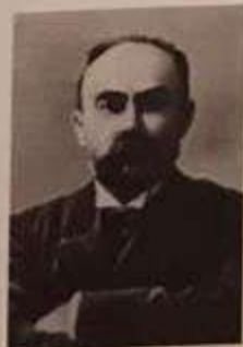
Плеханов Георгий Валентинович