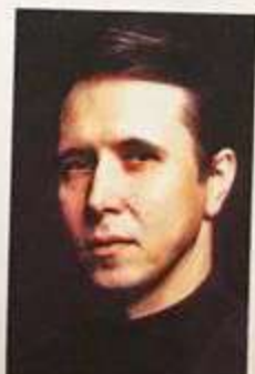
Плетнёв Михаил Васильевич

♦ Плеханов Георгий Валентинович [29.11 (11.12).1856, с. Гудановка, ныне Краснинский р-н Липецкой обл., — 30.5.1918, там же], российский революционер, экономист, философ, публицист, теоретик марксизма в Рос-