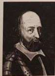
Плеттенберг Вальтер фон