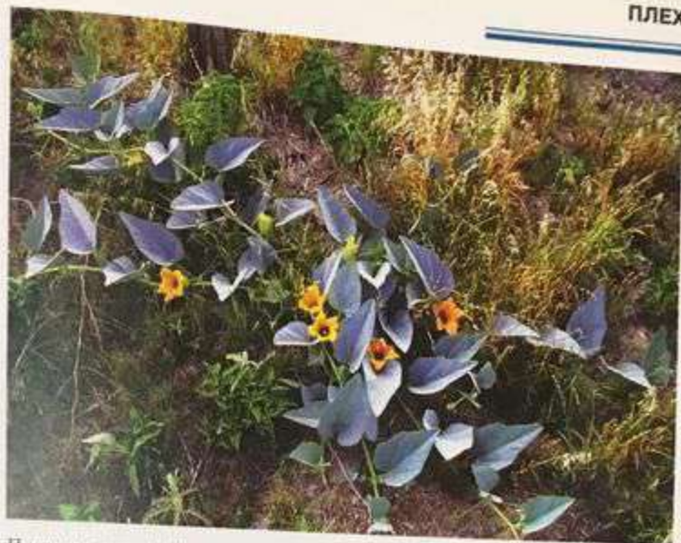
Плети у растений. Тыква

«Жизнь и сочинения Ивана Андреевича Крылова» (1847), «О жизни и сочинениях В. А. Жуковского» (1852).