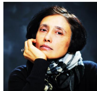
Конец 1990-х – начало 2000-х г.г.