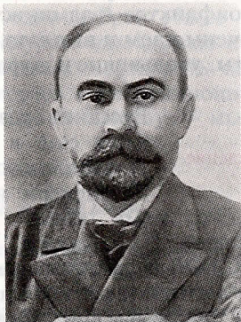
Г. В. Плеханов