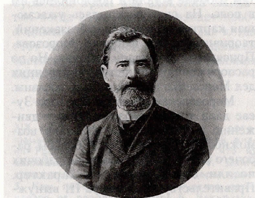
П. Б. Аксельрод

С самого начала группа «Освобождение труда» в качестве основной цели выдвинула выработку марксистской платформы российских революционеров, для чего предполагалось: распространение идей социализма путем перевода на русский язык и издания произведений К. Маркса и Ф. Энгельса, а также сочинений, популяризирующих эти идеи; критика ошибочных взглядов и тактики народников; разработка важнейших вопросов русской жизни с позиций марксизма и с учетом интересов трудящегося населения России.