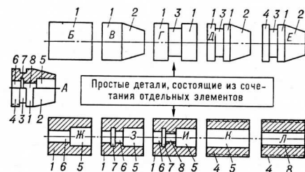
Схема групповой обработки с комплексной деталью: А — комплексная деталь, включающая 8 основных элементов; Б — Е — внешние поверхности простых деталей; Ж — Л — внутренние поверхности простых деталей; порядковые номера 1 — 8 обозначают аналогичные поверхности — цилиндрическую, коническую, резьбовую и т. д.

Разработка технологич. процесса Г. о. начинается с создания комплексной детали (рис.) — реальной, наиболее сложной в данной группе, либо условной, спроектированной как совокупность геом. элементов всех деталей группы. Технологич. процесс проектируется для комп-