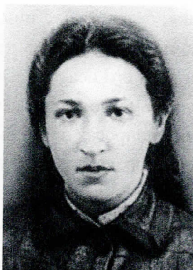
Вера Ивановна Засулич