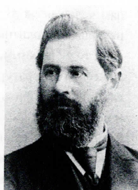
Павел Борисович Аксельрод

молодые марксистские силы России, и Плехановым, Аксельродом и Верой Засулич. Обе стороны были очень заинтересованы друг в друге и желали совместно наладить выпуск общерусской социал-демократической газеты «Искра» и теоретического журнала «Заря». Однако судя по уникальному документу дневникового характера, написанному Ульяновым по горячим следам переговоров и названному «Как чуть было не потухла “Искра”», Плеханов проявил властолюбие и неоправданную подозрительность к молодым товарищам. «Старики» почувствовали стремление Ульянова и Потресова играть в новых изданиях самостоятельную роль, и в связи с этим Георгий Валентинович откровенно капризничал – он то соглашался быть рядовым сотрудником «Искры», то начинал вести себя как единоличный редактор будущей газеты.