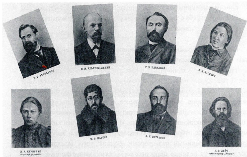
Редакция «Искры». 1900–1903 гг.

замашки Плеханова и его склонность ставить ультиматумы повергали Ленина в полное отчаяние, и он иногда серьезно начинал подумывать о том, чтобы бросить все, оставить «Зарю» Плеханову, а самому «сматывать удочки» и возвращаться в Россию, где и попытаться наладить издание общерусской газеты 30 .