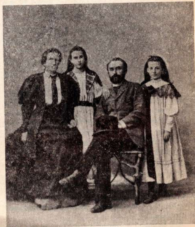
Г. В. Плеханов и его семья в начале 30-ых годов