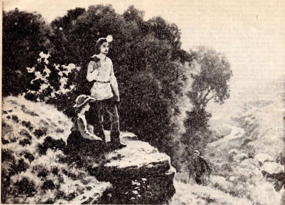
Г. В. Плеханов в Каменном лого во время каникул. Художник Н. И. Данышин