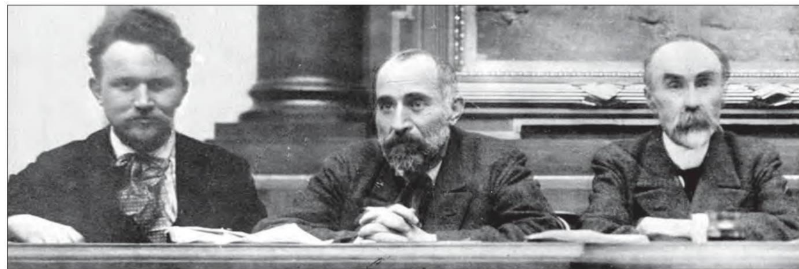
Георгий Плеханов (справа) с видными политиками своего времени Матвеем Скобелевым и Николаем Чхеидзе. Весна, 1917 год

За консультацией к Плеханову обращались самые различные политические деятели: адмирал А. Колчак советовался, как преодолеть растущую деморализацию на флоте; монархист М. Пуришкевич упрашивал его взять на себя управление страной. Плеханов бросал упреки Ленину в том, что он собирает под знамёна «разнузданную рабочую чернь», строит «псевдореволюционные планы» на недоразвитости «дикого, голодного пролетариата». Однако туберкулёз, которым он страдал с 1880-х годов, приближал к концу. С годами и болезнью