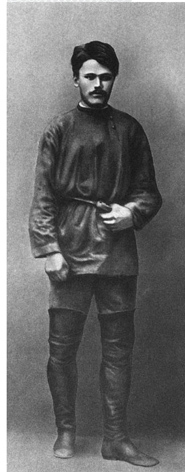
▲ Г. Плеханов в костюме рабочего. 1870-е годы