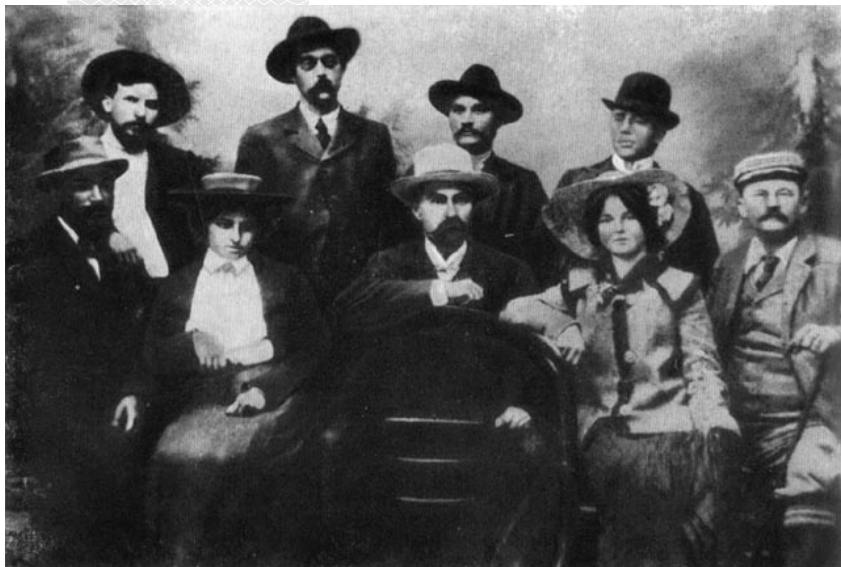
▼ Г. Плеханов (в центре) среди агентов «Искры»

Решением съезда участники плехановского союза были объявлены «членами партии РСДРП» [1, с. 157]. Таким образом, Г. Плеханов и в теоретическом, и в практическом смысле стал «начинателем» – это слово русский марксист позаимствовал в западной литературе. Им он называет «великих людей», что прослеживается, в частности, в его работе «К вопросу о роли личности в истории», опубликованной в 1898 году. Стал ли к этому времени великим человеком сам Г. Плеханов? В упомянутой работе он на примере Наполеона утверждает: для того чтобы стать великим человеком, необходимы соответствующие общественные условия [2, т. 2, с. 328, 333].