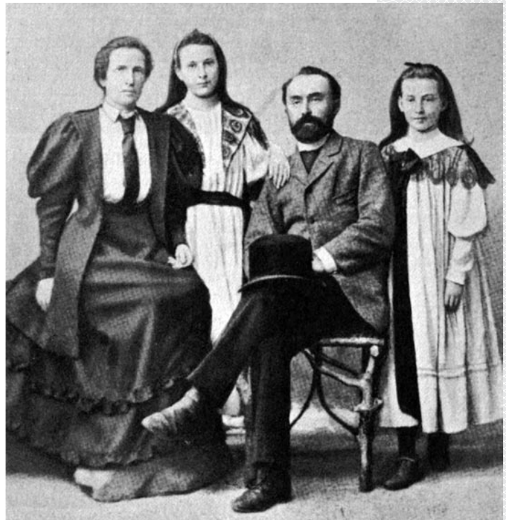
▲ Г. Плеханов с женой и дочерьми. Начало 1890-х годов