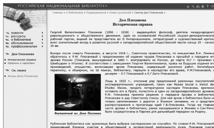
Публичная библиотека как творчески быт выбора исторически на скрупулы. По словам И.М. Плеханова, знаменитой филологической и общественной деятельности, Плехановский центр.

Но библиотекам не только присваивают почётные имена, но и дают специфические названия. В связи с этим обращает на себя внимание весьма примечательный факт — использование в названиях публичных библиотек слова «дом». Так, в Екатеринбурге к празднованию пушкинского юбилея в 1999 г. было приурочено создание Библиотечного культурно-просветительского центра «Пушкинский дом», органично объединившего библиотеку, музей и выставочный зал. 13 «Домом Поэтов» называют библиотеку-музей в с. Градницы (Бежецкий район Тверской обл.). 14 В 2004 г. в Москве была открыта Библиотека «Дом А. Ф. Лосева», а Московская городская библиотека №2 им. Н. В. Гоголя в 2005 г. была переименована в «Дом Гоголя». Пример из более отдалённого прошлого: в 1929 г. появился и по сей день существует в качестве подразделения РНБ «Дом Плеханова», созданный на основе домашней библиотеки и архива семьи Г. В. Плеханова. 15