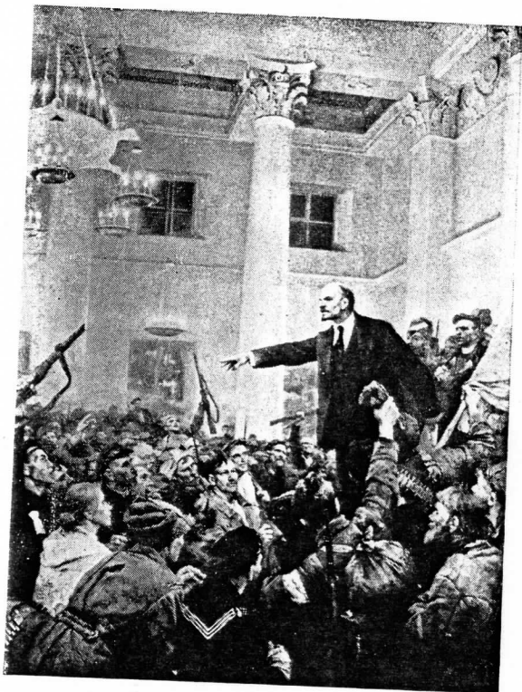
В. И. Ленин провозглашает Советскую власть на II Всероссийском съезде Советов. С картины художника В. А. Серова.