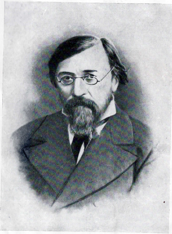
Н. Г. ЧЕРНЫШЕВСКИЙ 1828—1889

АКАДЕМИЯ НАУК СССР ИНСТИТУТ ФИЛОСОФИИ Н. Г. ЧЕРНЫШЕВСКИЙ